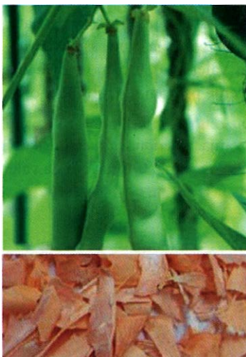
Slika 3. Perikarp graha ( Phaseoli pericarpium )

(alfa AI i alfa AI* – dva izoformna oblika koji imaju različite izoelektrične točke, ali istu molekulsku masu od 43 kDa) koji inhibiraju amilazu iz sline i amilazu iz gušterače. Alfa AI inhibitor usporava razgradnju škroba i na taj način kontrolira postprandijalno oslobađanje glukoze u šećernoj bolesti Tipa 2 (9). Kristalnu strukturu tih alfa amilaznih inhibitora razriješili su Nahoum i sur., 2000. godine (10). Alfa amilaza u kompleksu sa svojim inhibitorima postoji u dvije različite konformacije ovisne o pH. Važna rezidua je Arg-74, koja prije nije bila opažena, a ključna je za promjenu konformacije.