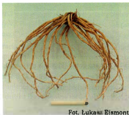
Slika 2. Korijen odoljena ( Valerianae radix )

Znanstvenu potvrdu djelovanja Valerianae officinalis kao blagog sedativa i trankvilizera opisao je Houghton P.J. 1999. godine. On navodi da valerijanska kiselina inhibira enzimom inducirano smanjenje GABA-e u mozgu i rezultira sedativnim učinkom (7).