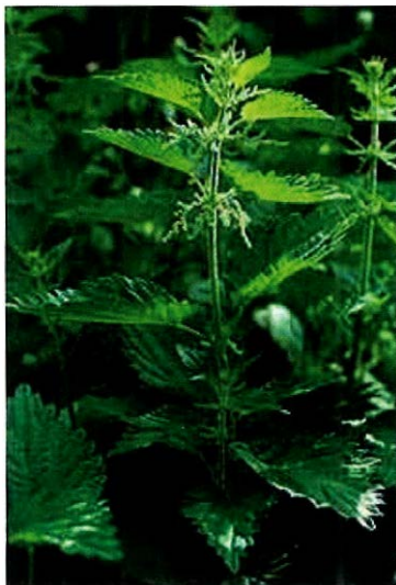
Slika 1. List koprive ( Urticae folium )

Djelovanje i primjena. U narodnoj medicini rabi se na mnogo načina: interno kao diuretik, kod reumatizma i artritisa, kao komponenta »antidijabetičnog« čaja, za brže zacjeljivanje rana, za poticanje rasta kose te pri oboljenjima prostate. Znanstveno je potvrđen njen diuretični učinak (2), povoljan učinak na hiperplaziju prostate (3,4) te na prevenciju kardiovaskularnih bolesti, jer je dokazano da inhibira agregaciju trombocita (5). Novija znanstvena istraživanja utvrdila su da ekstrakt koprive inhibira proinflamatornu transkripciju faktora NF - kapa B u in vitro uvjetima i tako sprječava nastajanje mnogih proinflamatornih produkata gena (6).