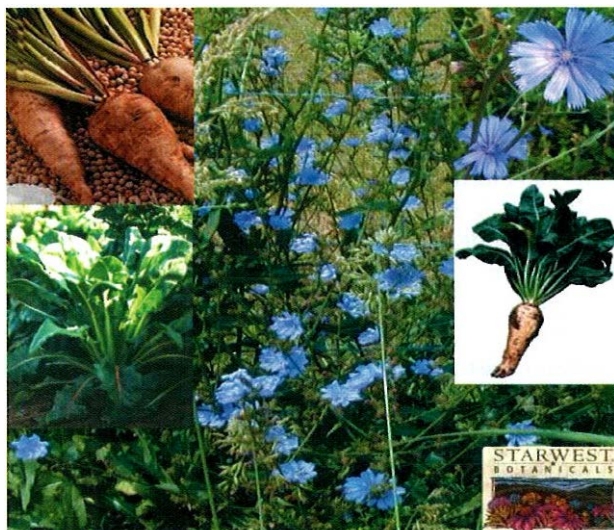
Slika 2. Korijen vodopije ( Cichorii radix )

Djelovanje i primjena. Korijen vodopije koristi se kao koleretik, diuretik, za poboljšanje apetita. Autori Zafar i sur. su 1998. godine opisali antihepatotoksičnu aktivnost ekstrakta korijena Cichorium intybus . Hepatotoksičnost je inducirana ugljiktetrakloridom koji je u jetri izazvao signifikantno povišenje katalitičke koncentracije enzima: AST, ALT te bilirubina; zatim je izazvao pad koncentracije proteina (albumina). Nakon tretmana životinja s ekstraktom korijena Cichorium intybus došlo je do signifikantnog pada katalitičke koncentracije tih enzima u jetri te bilirubina i do povećanja koncentracije proteina (albumina) u krvi (8). O antihepatotoksičnoj aktivnosti ekstrakta korijena Cichorium intybus pisali su i autori Gadgoli i sur. 1997. godine (9).