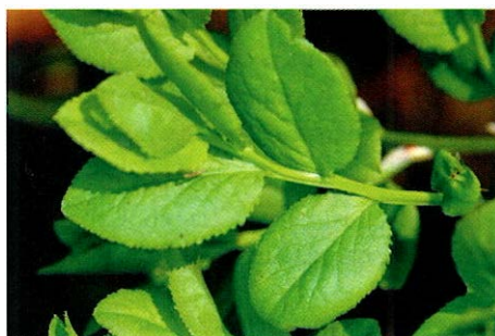
Slika 1. List borovnice ( Myrtilli folium )