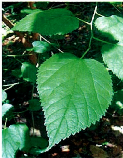
Slika 3. List crnog duda ( Mori nigrae folium )

20 kDa. Opisani protein snižuje razinu glukoze u streptozotocin induciranom hiperglikemijskom modelu u miševa i također povećava transport glukoze in vitro u masnim stanicama epididimusa. Analiziran je aminokiselinski sastav proteina i utvrđeno je da sadrži 20% serina i cisteina kao i inzulin (10).