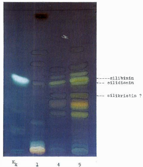
Slika 5. Kromatogram sastavnica listova i plodova sikavice

3 – etanolni ekstrakt listova (tinktura)