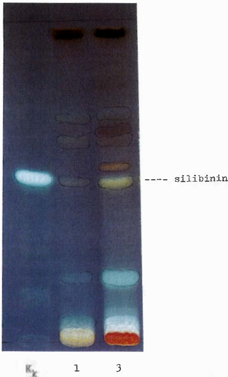
Slika 4. Kromatogram sastavnica listova sikavice

Nadalje, kvalitativnom analizom na tankom sloju silikagela dokazani su flavonolignani u ekstraktima plodova sikavice. Na snimci kromatograma (Slika 5) uočeno je nekoliko dobro odijeljenih zona, koje su pri UV 365nm fluorescirale u nijansama žutozeleno boje. Od spomenutih zona dobro je uočljiva