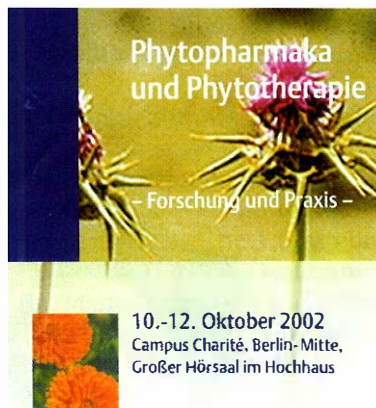
Slika 1. Naslovna strana prospekta o Kongresu u Berlinu 2002.

Sikavica ( S. marianum , Asteraceae) i preparati izrađeni na osnovi ekstrakata ove biljke, još su uvijek u vrhu fitofarmaka, što dokazuje i naslovna strana prospekta kojim je bio najavljen Kongres u Berlinu 2002. (Slika 1). Bio je to kongres znatno drukčijeg sadržaja od uobičajenih kongresa o istraživanju ljekovitog bilja i vrednovanju biljnih lijekova. Razlikovao se i po