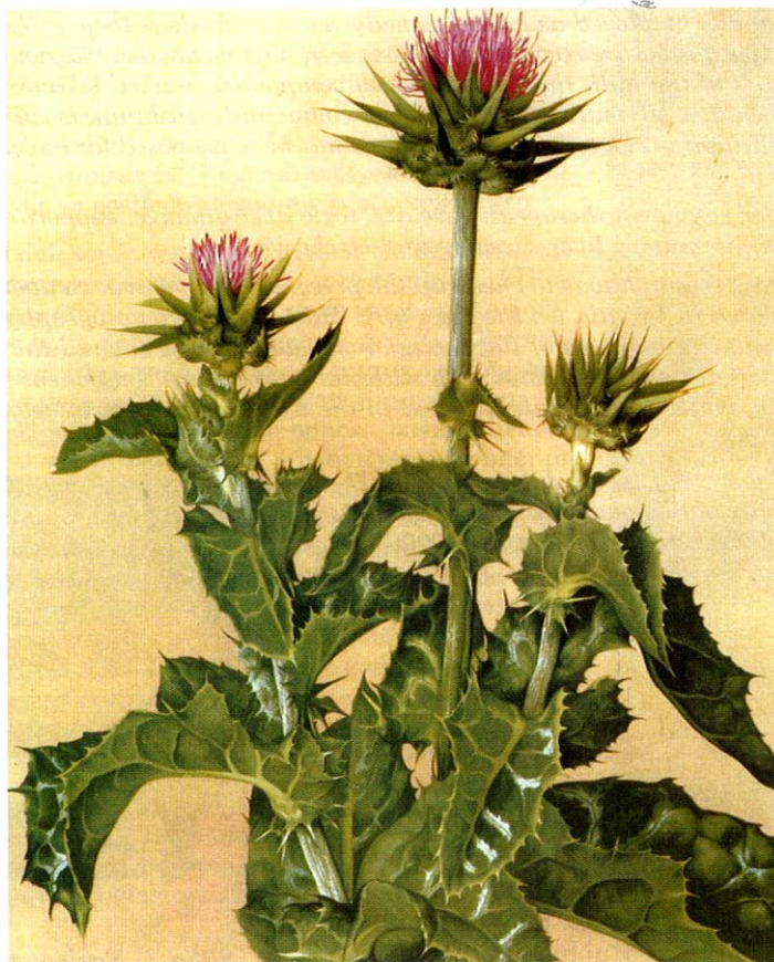
Slika 2. Sikavica – Silybum marianum (L.) Gaertn. (sinonim: Carduus marianus L.) – Asteraceae (Madaus)

Sikavica je kod nas samoniklo rasprostranjena u Dalmaciji, u podnožju Biokova (1), kao i u Hercegovini, na suhim i sunčanim mjestima. Obično raste kraj putova, naselja, po željezničkim nasipima, posebice na toplim i kamenitim staništima. To je razgranata dvogodišnja, zeljasta biljka visine i do 1,5 m. Bogato je obrasla listovima koji su prošarani bijelim prugama. Cvjetne glavice su velike, ljubičaste ili purpurnocrvene boje. (Slika 2). Plodovi sikavice, Fructus cardui mariae (= Silybi mariani fructus ), često pod neispravnim nazivom Semen cardui mariae (2) bili su upotrebljavani kao biljni lijek, a u novije vrijeme zbog znanstveno dokazanog terapijskog učinka ulaze u sastav biljnih lijekova koji se primijenjuju u terapiji oboljenja jetre. Iz plodova sika-