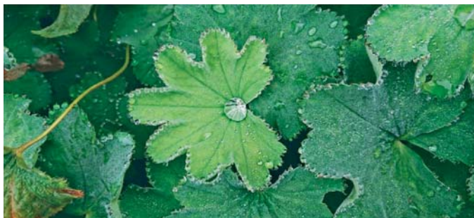
Slika 1. ► Listovi vrste Alchemilla vulgaris L. (4)

Osim pod nazivom vrkuta, ova je biljna vrsta poznata i kao virak, plahtica, rosanica, rosica, rosnik, lava i gospin plašt (engl. Lady's mantle ) (5). Naziv »gospin plašt« u prošlosti se tumačio na razne načine. Može ga se povezati s kišnim