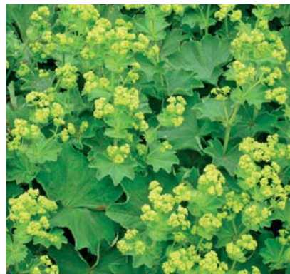
Slika 2. ► Listovi i cvatovi vrste Alchemilla vulgaris L. (14)

Kod vrkute se mogu razlikovati dva tipa listova. Prizemni listovi s dugom peteljkom, bubrežastog ili gotovo okruglog oblika, mogu dosežati od 8 do 11 cm u promjeru, a imaju od 7 do 9, a ponekad i 11 režnjeva. Drugi tip listova čine stabljični listovi koji su manji, imaju kraću peteljku ili mogu biti sjedeći, podijeljeni su na od 5 do 9 režnjeva te imaju par velikih palistića. Listovi su osobito dlakavi na naličju te imaju pilasti rub. Sitni cvjetovi žutozelene do svijetlozelene boje sastoje se od vanjskih listova čaške i lapova, dok im latice nedostaju. Imaju 4 kratka prašnika i tučak, a nalaze se okupljeni u nepravilne metličaste cvatove na uzdužno naboranoj i šupljij cvjetnoj stapci (slika 2.) (6, 10, 13).