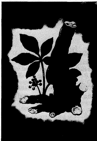
Slika 1. Eleutherococcus senticosus Maxim.

Wagner (4) je sistematizirajući droge i njihove djelatne supstancije prema farmakološko-terapijskom učinku razvrstao eleuterokok u grupu – roborancija, tonika i geriatrika. Radix Eleutherococci , prema Wagneru (4), uz lignane i kumarine sadrži saponinske heterozide – eleuterozide. Saponini su triterpenske strukture, s aglikonom oleanolskom kiselinom, a u šećernom dijelu zastupljeni su glukoza, ramnoza i arabinoza.