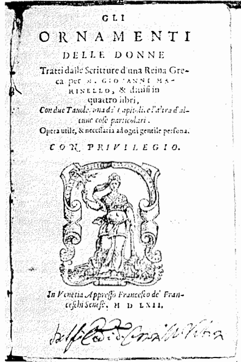
Slika 4. M. G. Marinelli: Ukrašavnje gospoda, Venecija 1562. god. Prva sačuvana knjiga o kozmetici na tlu Italije.(13)

U Europi već od IX. stoljeća djeluje visoka medicinska škola u Salernu, koja je bila preteča medicinskih fakulteta. Tu predaju brojni profesori kirurgije, fiziologije i drugih grana medicine te pišu znamenita djela. Za kozmetologiju je važna Trotula za koju se točno ne zna je li bila liječnica ili babica, ali se zna da je u prvoj polovici XII. stoljeća napisala djelo o ženskim bolestima »De passionibus mulierum«, a u njemu je dio posvetila kozmetici. Ona piše o izbjeljivanju i bojenju kose, uklanjanju bora i proširenih žilica te o liječenju usnica (5).