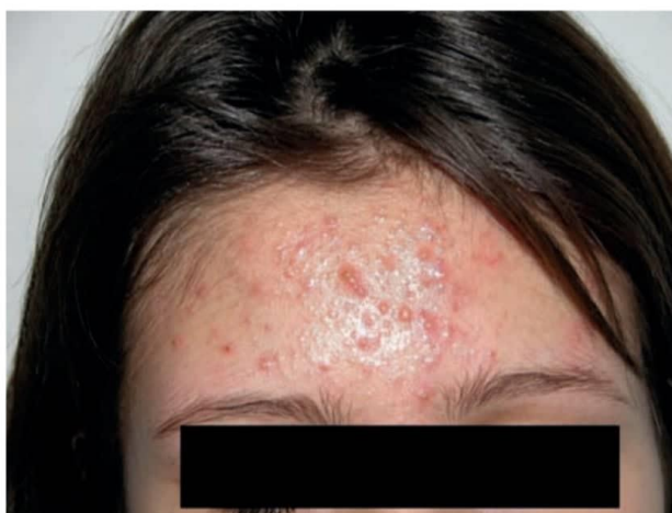
Slika 4. Acne papulopustulosa (Basta Juzbašić, 2010)