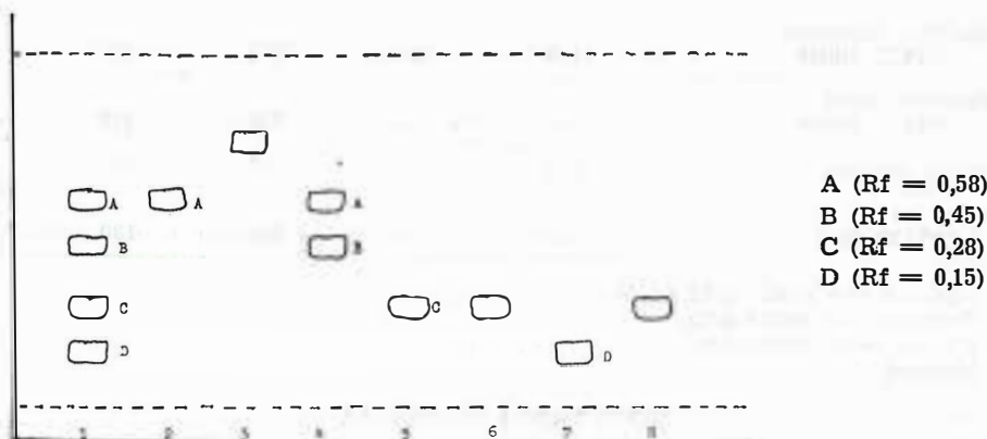
Slika 2. Kromatografija flavonskih supstancija na tankom sloju silikagela G po Stahlu

Sistem: etilacetat — mravlja kiselina — voda 80:10:10 Reagens za detekciju: borna kiselina 15 ml i oksalna kiselina 5 ml 1 — metanolni ekstrakt droge 3 — kempferol-3-arabinozid (Rf = 0,75) 6 — rutin (Rf = 0,28) 8 — vitexsin-4-ramnozid (Rf = 0,28)