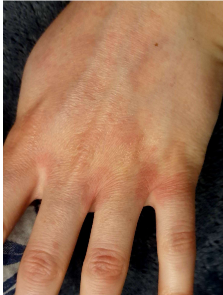
Slika 3. Antisepticima uzrokovan kontaktni dermatitis