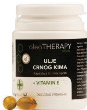
Slika 6. Kapsule s uljem crnog kima