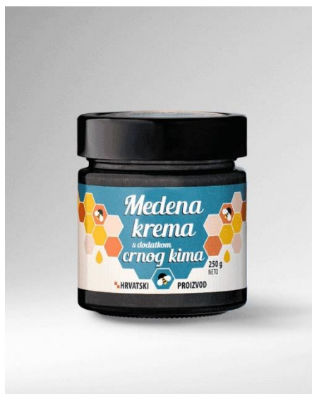
Slika 4. Medena krema s dodatkom crnog kima ( webljekarna.vasezdravlje.com )

Mast crnog kima sadrži hladna prešana ulja crnog kima i noćurka koja su bogata višestruko nezasićenim masnim kiselinama (slika 7). Mast sadrži i ekstrakte nevena i zobi koji potiču izmjenu tvari u stanicama kože, smiruju intenzitet upala i potiču obnavljanje kože. Nanosi se na kožu nekoliko puta na dan. Ne preporučuje se uzimanje pripravka osobama alergičnima na neven i zob ( webljekarna.vasezdravlje.com ). Mast crnog kima je samo za vanjsku primjenu za sve tipove kože. i povoljno djeluje na oštećenje kože, ekceme, ožiljke i fibroze. Ulje crnog kima povoljno djeluje na gljivična oboljenja kože te na suhu i ljuskavu kožu. Smatra se da ulje crnog kima sprječava nastajanje bora, a postojeće bore da smanjuje svakodnevnom upotrebom, a kožu čini mladalačkom, elastičnom i mekom. Također mast crnog kima može pomoći i kod brojnih drugih kožnih problema poput strija, ožiljaka, psorijaze, akni, crvenila, seboreičnog dermatitisa, lišajeva te staračkih pjega ( lavandamia.hr ).