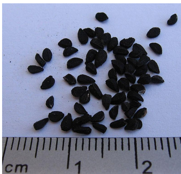
Slika 2. Sjemenke crnog kima

Sjemenke crnog kima, makroskopski, su male, izvana crne, iznutra bijele boje, aromatičnog mirisa i gorkog okusa (slika 2). Poprečni presjek sjemenki, mikroskopski, pokazuje jednoslojnu epidermu koja se sastoji od eliptičnih, debelih zidova koji su pokriveni kutikulom te ispunjeni sadržajem tamnosmeđe boje. Epiderma se sastoji od dva do četiri sloja tangencijalno izduženih parenhimskih stanica te debelih zidova koji su crveno smeđih pigmenata. Unutar pigmenata nalazi se sloj debelih, pravokutno izduženih, stupastih stanica. Endosperm se sastoji od tankih pravokutnih ili poligonalnih stanica ispunjenih uljnim kuglicama (Khare, 2004).