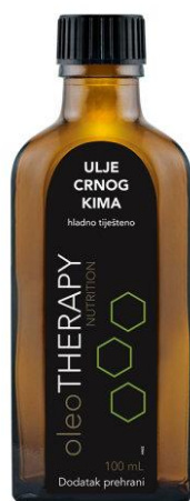
Slika 5. Ulje crnog kima