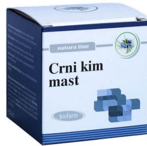
Slika 7. Crni kim mast