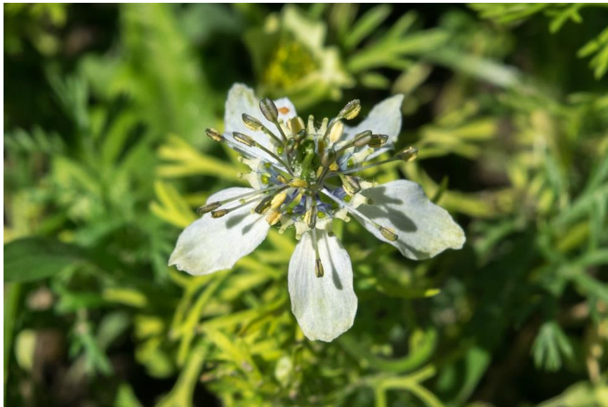
Slika 1. Crni kim

Biljna vrsta Nigella sativa L., uobičajeno poznata kao crni kim, je biljka iz porodice Ranunculaceae. To je jednogodišnja zeljasta biljka koja može narasti 20 do 90 cm sa sitno podijeljenim listovima. Stabljika je zelenosive boje, a listovi su izmjenični i neparnoperasti. Cvjetovi su hermafroditni, sadrže tučak i prašnike, a obično su obojeni u bijelu, žutu, ružičastu, blijedoplavu ili blijedoljubičastu boju, s dugačkim lapovima i medonosnim laticama (slika 1). Prisutan je velik broj prašnika, a tučak se sastoji od pet sraslih oplodnih listića. Plod je velika napuhana kapsula sastavljena od 3 do 7 sjedinjenih folikula, a svaki od njih sadrži brojne sjemenke. Crni kim je porijeklom iz južne Europe, Sjeverne Afrike i jugozapadne Azije no uzgaja se u mnogim zemljama svijeta kao što su bliskoistočna mediteranska regija, južna Europa, Indija, Pakistan, Sirija, Turska te Saudijska Arabija (Sultana i sur., 2015). Latinsko ime roda Nigella potječe od latinske riječi niger (crn) zbog boje sjemenki. Ime vrste sativa je također latinskog porijekla i znači kultivirana jer je kultivirana tisućama godina prije nego ju je švedski botaničar Carl Linnaeus imenovao 1753. godine ( www.plantea.com.hr , Horvat 2017).