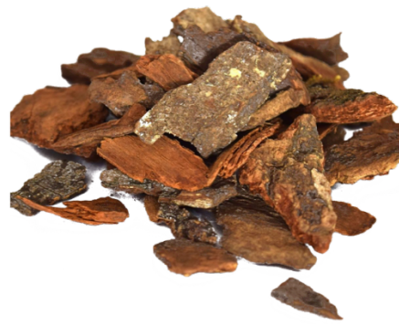
Slika 4. Manjishta ( Rubia cordifolia , radix), arjuna ( Terminalia arjuna , cortex)