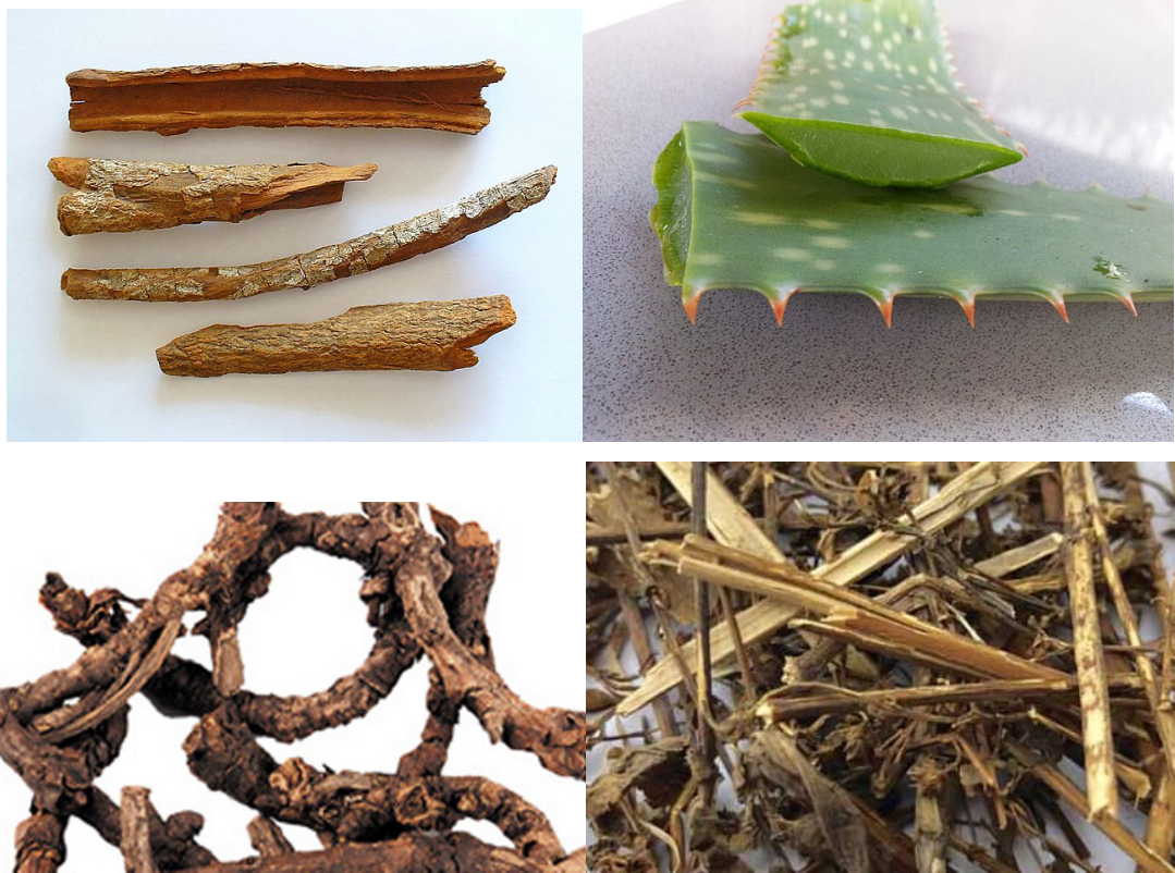
Slika 5. Kininovac ( Cinchona officinalis , cortex), aloja ( Aloe barbadensis , herba/succinum), kutki ( Picrorrhiza kurrooa , rhizoma), chirata ( Swertia chirata , folium) (preuzeto s https://healthyayurveda.com , https://commons.wikimedia.org i https://www.lybrate.com ).

Tipični gorki tonici i antipiretici uključuju aloe veru ( Aloe barbadensis ), američku kolumbariju ( Frasera caroliniensis ), sirištaru ( Gentiana sp. ), kanadsku žutiku ( Hydrastis canadensis ), kininovac ( Cinchona officinalis/pubescens/calisaya ), bijelu topolu ( Populus alba ), i specifično za Indiju, chirata ( Swertia chirata ), kutki ( Picrorhiza kurrooa ) i nim ( Azadirachta indica ) (Frawley i Lad, 2001; Dass, 2013).