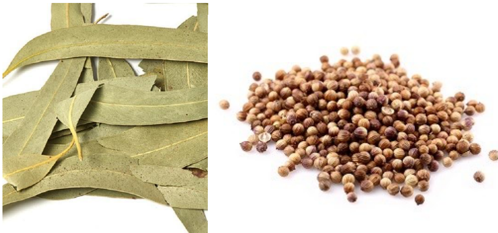
Slika 7. Eukaliptus ( Eucalyptus sp., folium), korijandar ( Coriandrum sativum , fructus)

Tipični rashlađujućí dijaforetici: resnik ( Eupatorium perfoliatum ), čičak ( Arctium sp.), mačja metvica ( Nepeta cataria ), kamilica ( Matricaria chamomilla , Chamaemelum nobile ), krizantema ( Chrysanthemum indicum ), korijandar ( Coriandrum sativum ), bazga ( Sambucus nigra ), marulja ( Marrubium vulgare ), poljska preslica ( Equisetum arvense ), paprena metvica ( Mentha x piperita ), obična menta ( Mentha spicata ), stolisnik ( Achillea millefolium ) (Frawley i Lad, 2001; Dass, 2013).