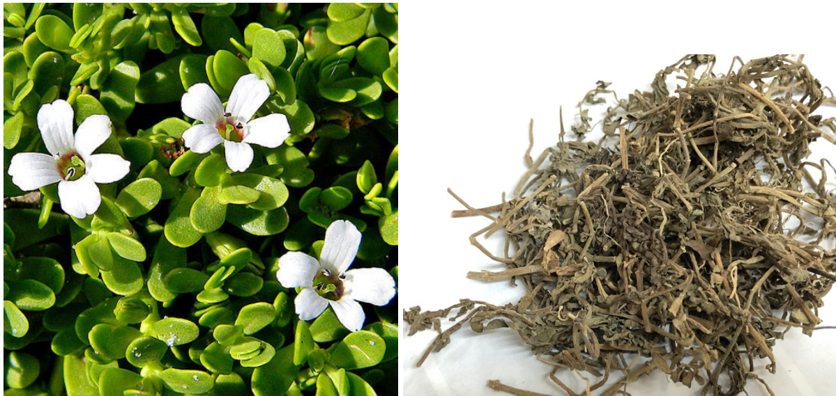
Slika 23. Bacopa monnieri – ljekovita biljka i biljna droga Bacopae monnieri herba

triterpenski saponini (bakoziidi A i B), alkaloidi (brahmin, nikotinin, herpestin), flavonoidi (luteolin, apigenin)