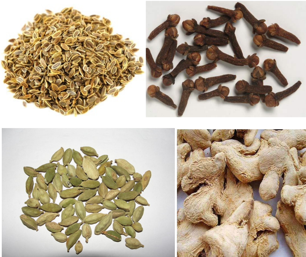
Slika 6. Kopar ( Anethum graveolens , sjemenka), klinčić ( Syzygium aromaticum , flos), kardamom ( Elettaria cardamomum , fructus), đumbir ( Zingiber officinale , rhizoma) (preuzeto s https://www.planetayurveda.com , http://www.plantsoftheworldonline.org , https://www.indiamart.com )

Normalizacijom Vate indirektno utječu na agni , probavnu vatru, pa su sličnog, ali ne i istog djelovanja kao stimulirajuće biljke koje direktno utječu na nju. Karminativne biljke zbog svog su djelovanja posebno dobre za probavne trgoobe uzrokovanu stresom, anksioznosti i depresijom. Djeluju tako da uklanjaju zastoje u svim kanalima, otvaraju živčani sustav i olakšavaju grčeve i bol. Mogu djelovati i kao dijaforetici i ekspektoransi, i često su cirkulacijski stimulansi. Poboljšavaju opće stanje i potiču osnovni protok tjelesna energije, prane .