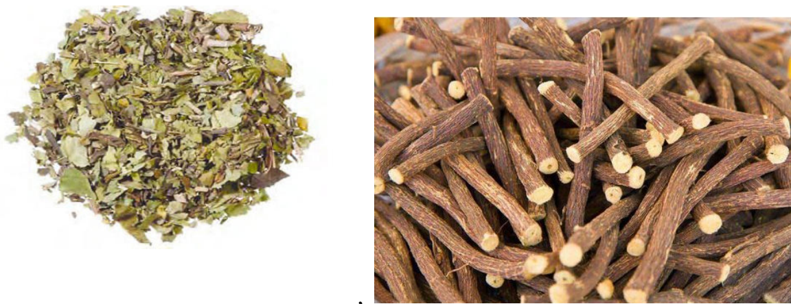
Slika 10. Malabarski orah, vasaka ( Adhatoda vasica , folium), sladić, yashtimadhu ( Glycyrrhiza glabra , radix)

Tipične biljke koje ublažavaju kašalj: koštice marelice ( Prunus armeniaca ), kayaphal ( Myrica nagi/esculenta ), malabarski orah, vasa, vasaka ( Adhatoda vasica ), podbjel ( Tussilago farfara ), kositernica ( Ephedra vulgaris ), eukaliptus ( Eucalyptus sp. ), grindelia ( Grindelia sp. ), marulja ( Marrubium vulgare ), divizma ( Verbascum sp. ), timijan ( Thymus vulgaris ), trešnja ( Prunus avium ) (Frawley i Lad, 2001; Dass, 2013).