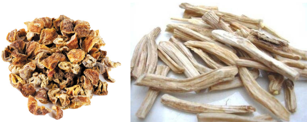
Slika 14. Amalaki, amla ( Phyllanthus emblica , fructus) i shatavari ( Asparagus racemosus , radix)

Tipični nutritivni tonici: badem ( Prunus dulcis ), amalaki (amla, indijski ogrozd, Phyllanthus emblica ), ljekovita anđelika ( Angelica archangelica ), bala ( Sida cordifolia ), kokos ( Cocos nucifera ), gaveza ( Symphytum officinale ), datulje ( Phoenix dactylifera ), lan ( Linum usitatissimum ), ginseng ( Panax ginseng ), med, karagen ( Chondrus crispus ), sladić ( Glycyrrhiza glabra ), lotos ( Nelumbo nucifera ), bijeli sljez ( Althaea officinalis ), mlijeko, groždice (sušeni plodovi Vitis sp. ), rehmanija ( Rehmannia glutinosa ), sabal palma ( Serenoa repens ), sezam ( Sesamum indicum ), shatavari ( Asparagus racemosus ), glatki brijest ( Ulmus rubra ), pokosnica ( Polygonatum sp. ), jatamansi ( Nardostachys jatamansi ), šećer, vidari kanda ( Pueraria tuberosa ), divlji jam ( Dioscorea villosa ) (Frawley i Lad, 2001; Dass, 2013).