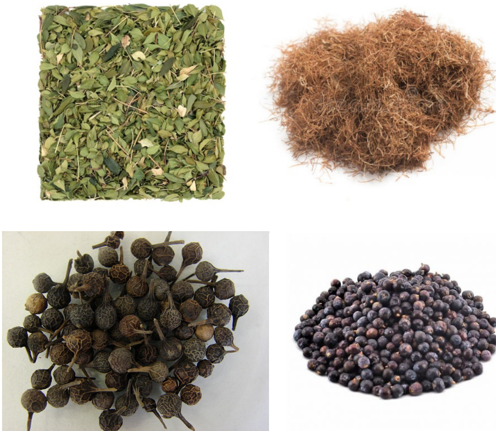
Slika 8. Buchu ( Agathosma betulina , semen), kukuruzna svila ( Stigma maydis ) kubeba ( Piper cubeba , fructus), borovica ( Juniperus communis , pseudofructus)