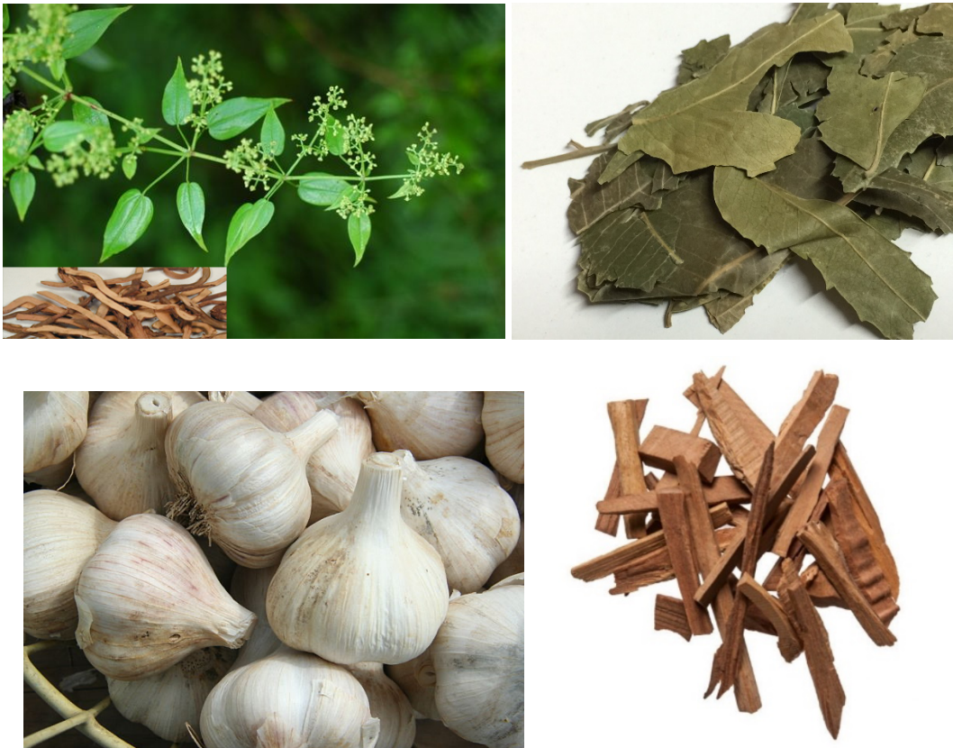
Slika 2. Indijski broć ( Rubia cordifolia , radix), nim ( Azadirachta indica , folium), češnjak ( Allium sativum , bulbus), sandalovina ( Santalum album , lignum)

Većina biljaka ove skupine gorkog su okusa i rashlađuju. Smanjuju Pittu i Kaphu , a povećavaju Vatu pa se većinom smatraju anti- Pitta biljke.