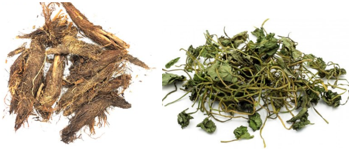
Slika 12. Jatamansi ( Nardostachys jatamansi , rhizoma), gotu kola ( Centella asiatica , herba)

Tipične rashlađujuće biljke za živce i spazmolitičke biljke: jatamansi ( Nardostachys jatamansi , sin. Valeriana jatamansi ), betonika ( Betonica officinalis ), bhringaraj ( Eclipta prostrata ), mačja metvica ( Nepeta cataria ), kamilica ( Matricaria chamomilla ), gotu kola ( Centella asiatica ), jasmin ( Jasminum officinale ), jatamansi ( Nardostachys jatamansi ), srčenica ( Leonurus cardiaca ), zob ( Avena sativa ), pasiflora ( Passiflora incarnata ), paprena metvica ( Mentha x piperita ), sandalovina ( Santalum album ), grozničica ( Scutellaria lateriflora ), gospina trava ( Hypericum perforatum ), sporiš ( Verbena sp. ), divlji jam ( Dioscorea villosa ) (Frawley i Lad, 2001, Pole, 2006).