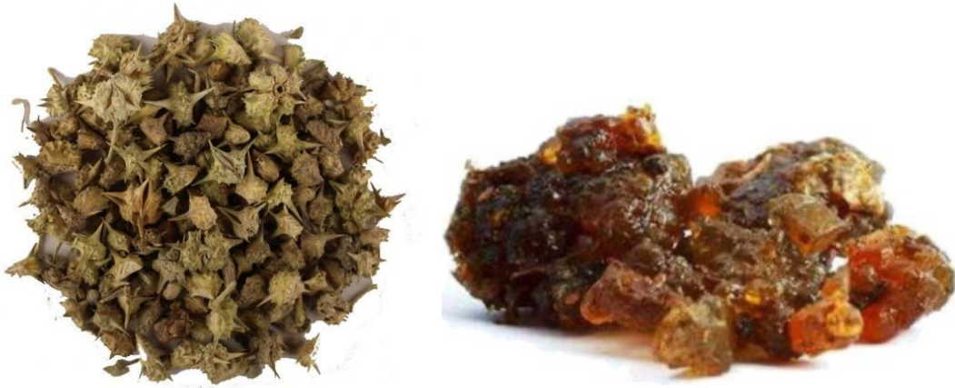
Slika 15. Tribulus, gokshura ( Tribulus terrestris , fructus) i guggul ( Commiphora mukul , resin) (preuzeto s https://www.indiamart.com )