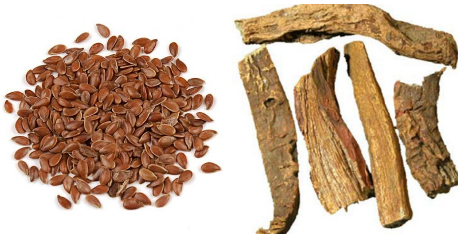
Slika 11. Lan ( Linum usitatissimum , semen), rabarbara ( Rheum palmatum , radix)

Rashlađujuće biljke s različitim stupnjevima laksativnog djelovanja: aloja ( Aloe barbadensis ), američka krkavina ( Rhamnus purshiana ), rabarbara ( Rheum rhabarbarum ), sena ( Cassia angustifolia/senna ), kovrčava kiselica ( Rumex crispus ). Jaki purgativi i blagi laksativi mogu se kombinirati za postizanje umjerenog učinka (Frawley i Lad, 2001).