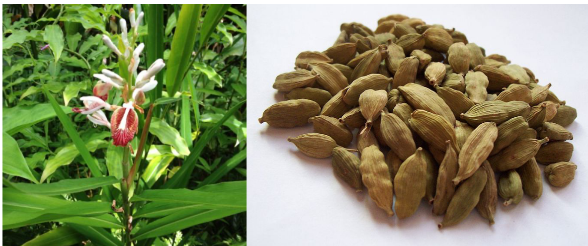
Slika 24. Elettaria cardamomum – ljekovita biljka i droge Cardamomi fructus ( Cardamomi semen )