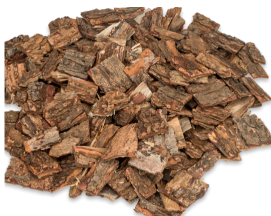
Slika 28. Azadirachta indica – ljekovita biljka i biljne droge Azadirachtae semen , Azadirachtae folium i Azadirachtae cortex