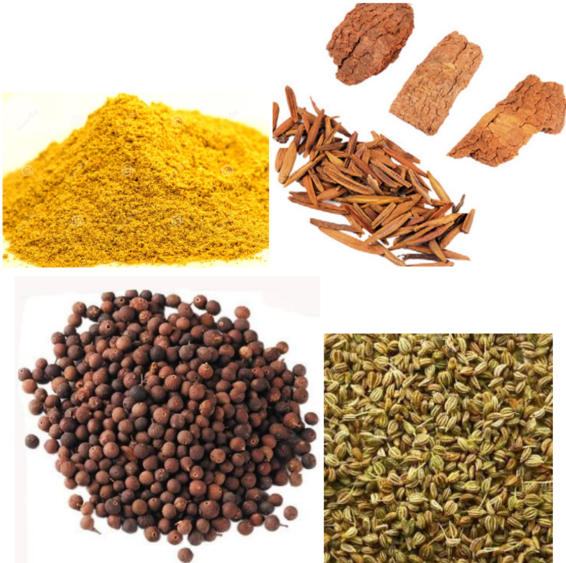
Slika 3. Asafoetida ( Ferula asafoetida/foetida , resin), kutaja ( Holarrhena antidysenterica , cortex), vidanga ( Embelia ribes , fructus), ajwain ( Trachyspermum ammi , fructus)