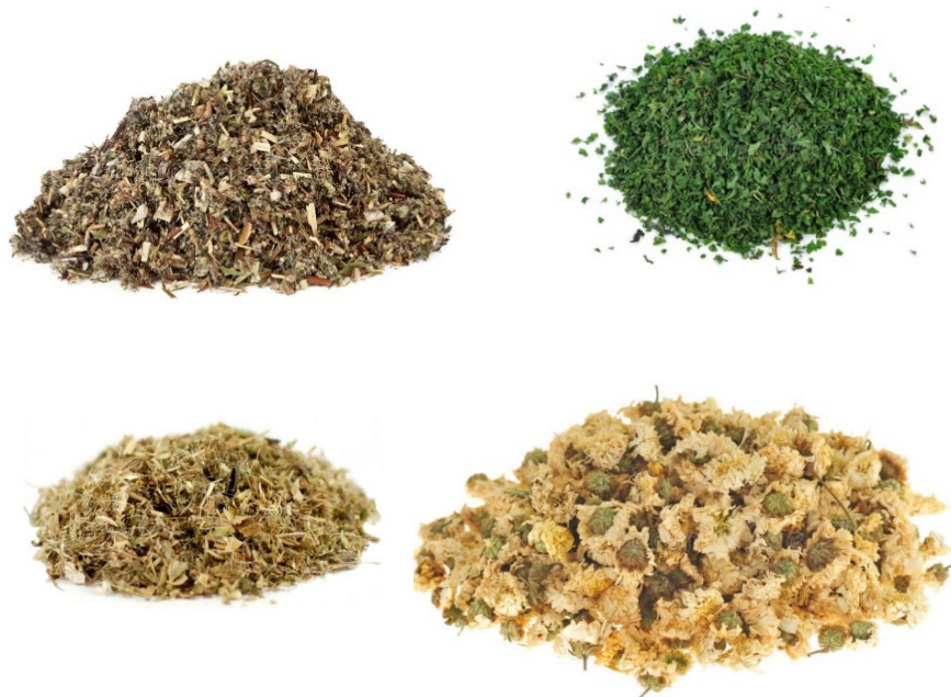
Slika 9. Divlji pelin ( Artemisia vulgaris , folium), peršin ( Petroselinum crispum , folium) blaženi čkalj ( Cnicus benedictus , herba), krizantema ( Chrysanthemum indicum , flos)

Tipični rashlađujući emenagozi: blaženi čkalj ( Cnicus benedictus ), kamilica ( Matricaria chamomilla ), krizantema ( Chrysanthemum indicum ), hibiskus ( Hibiscus sp. ), manjishta ( Rubia cordifolia ), srčenica ( Leonurus cardiaca ), jaglac ( Primula vulgaris ), malina ( Rubus idaeus ), stolisnik ( Achillea millefolium ) (Frawley i Lad, 2001; Dass, 2013).