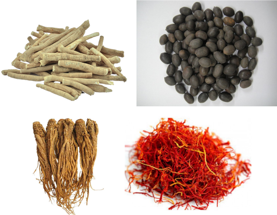
Slika 21. Ashwagandha ( Withania somnifera , radix), lotus ( Nelumbo nucifera , semen), kineska anđelika ( Angelica sinensis , radix), šafran ( Crocus sativus , stigmata)

( Serenoa repens ), shatavari ( Asparagus racemosus ), vidari kanda ( Pueraria tuberosa ), divlji jam ( Dioscorea villosa ). Od ovih, oni koji su emenagozi specifičniji su za žene. Ajurveda također razlikuje one biljke koje pojačavaju spermatogenezu, nazvane Shukrala . To su stvari koje su nutritivni tonici za reproduktivni sustav, kao sjeme i majčino mlijeko. Većinom su to hranjive Vajikarane . Takvi nutritivni afrodizijaci uključuju mnoge od prethodno navedenih droga (Frawley i Lad, 2001).