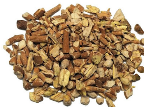
Slika 22. Withania somnifera – ljekovita biljka i biljna droga Withaniae somniferae radix

Ajurvedska energetska obilježja droge (API, 2001; Pole, 2006)