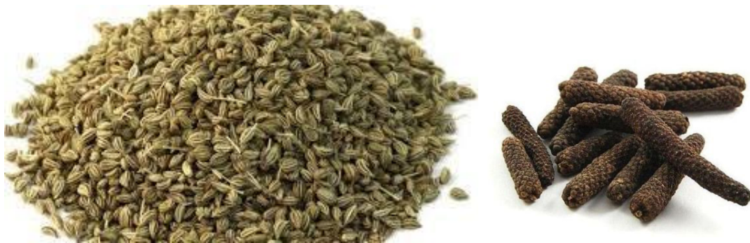
Slika 13. Ajwan ( Trachyspermum ammi , fructus) i dugački papar, pippali ( Piper longum , fructus)

su kada je potrebno poboljšati probavu, otjerati prehladu, ukloniti toksine i naslage na jeziku, te oživiti oslabljen metabolizam i cirkulaciju. Kontraindicirani su u stanjima dehidracije, nedostatka tekućine i upalnim stanjima sluznice. Ne smiju se primjenjivati direktno na sluznicu. Tipične stimulatívne biljke su: ajwan ( Trachyspermum ammi ), asafetida (sušeni lateks Ferula foetida/assa-foetida ), crni papar ( Piper nigrum ), kajenski papar ( Capsicum annum ), cimet ( Cinnamomum verum/cassia ), klinčić ( Syzygium aromaticum ), češnjak ( Allium sativum ), đumbir ( Zingiber officinale ), hren ( Armoracia rusticana ), gorušica ( Brassica nigra/juncea ), luk ( Allium cepa ), dugački papar, pippali ( Piper longum ) (Frawley i Lad, 2001).