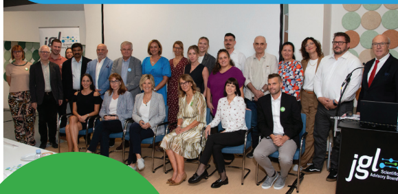
The JGL Scientific Advisory Board with JGL team

The company's leading export brand is Aqua Maris, launched in 1999, which consists of 100% natural products based on seawater from the Adriatic, used for the prevention and treatment of upper respiratory tract diseases. Other key brands include Vizol S, Meralys, Aknekutan and Dramina.