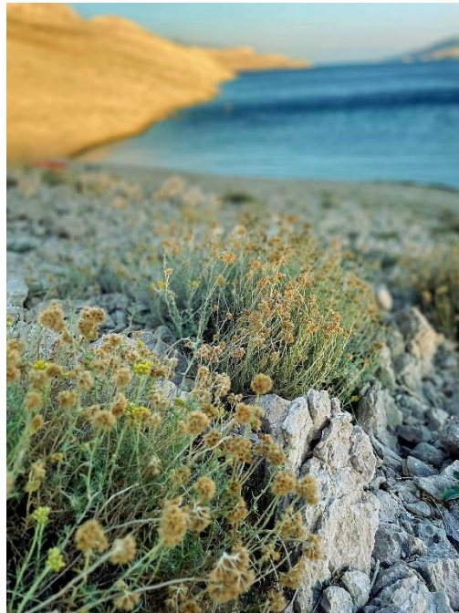
Slika 1. Smilje na otoku Pagu (fotografija Marina Đeldum Kustić, 8. rujna 2023.)

Sredozemno smilje - Helichrysum italicum (Roth) G. Don višegodišnji je polugrm visine do 70 cm koji raste duž mediteranske obale. Biljka je karakteristična po svojim vrlo aromatičnim zlatnožutim cvjetovima (slika 1), a cvate u razdoblju od svibnja/lipnja do kolovoza/rujna (1).