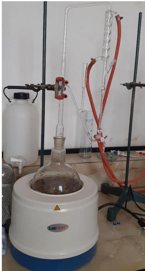
Slika 4. Aparatura za određivanje i izolacija eteričnog ulja iz cvjetova sredozemnog smilja s otoka Paga i Visa (Zavod za farmakognoziju Farmaceutsko-biokemijskog fakulteta)

biljnog materijala podvrgnuto tijekom 90 minuta pari generiranoj parogeneratorom, pri brzini pare od 70 kg/min.