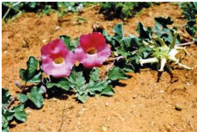
Slika 8. Vražja kandža – Harpagophytum procumbens (Burch.) DC. ex Meisn. (23)

a bočno korijenje je zadebljano poput gomolja. Rasprostranjena je u južnim polupustinjskim dijelovima Afrike. Korijen vražje kandže sastoji se od osušenog, narezanog sekundarnog vretenastog korijena. Glavni sastojci korijena su iridoidni heterozidi harpagozid i prokumbid (8, 12). Ostale sastavnice su fitosteroli, triterpeni, flavonoidi, fenolne kiseline i šećeri. Korijen vražje kandže je antiinflamatorno sredstvo i blagi analgetik. Djelovanje je povezano s aktivnosti iridoida. Kod reume se preporuča lokalna primjena krema ili masti od vražje kandže (18).