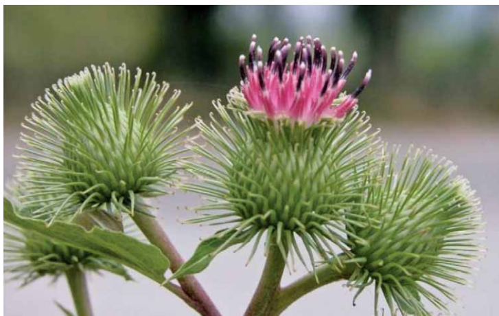
Slika 7. Čičak – Arctium lappa L. (21)

Korijen i list čička – Arctium lappa L., Asteraceae) (7) (slika 7.) te čaj od čičkovih sjemenki također se koriste za ublažavanje simptoma reume. Čičak raste na neobrađenim tlima, smetlištima, uz živice, pokraj puteva i u blizini naselja. U korijenu čička nalazi se polifruktozid inulin. Osim inulina, u biljci su prisutne i gorke tvari, eterično ulje, netopljive gume, trjeslovine, sumporni spojevi, kalijev fosfat, željezo itd. (13).