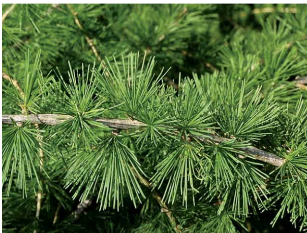
Slika 5. Europski ariš – Larix decidua Mill. (19)

Europski (listopadni) ariš – Larix decidua Mill., Pinaceae (7) (slika 5.) je planinsko drvo visoko 20–50 metara, a rasprostranjeno je u srednjoj Europi. Kod reumatskih tegoba primjenjuje se izvana terpentini ariša, a sastoji se od balzama dobivenog zarezivanjem stabla (12). Balzam sadržava približno 15 % hlapljivog dijela koji se sastoji uglavnom od \alpha -pinena. Ugodan miris ariševog balzama potječe od borneola. Moguće su alergijske reakcije na koži kod lokalne primjene pa je potreban oprez (9).