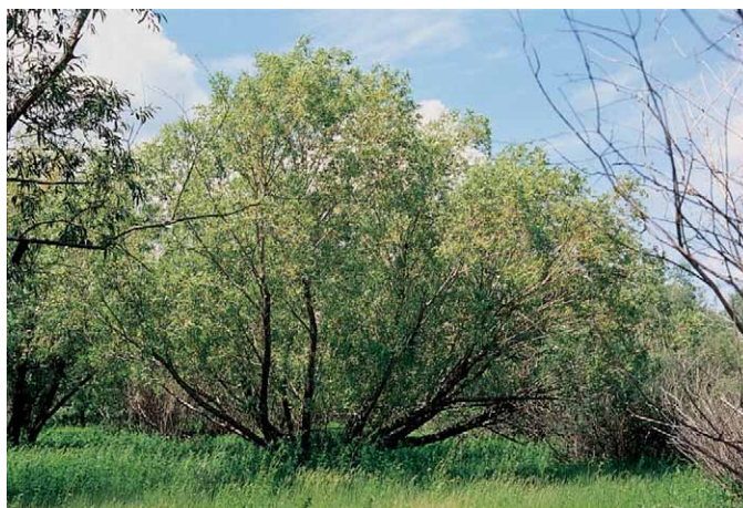
Slika 1. Bijela vrba – Salix alba L. (10)

savijenih grana koje raste pored vodenih i poplavljenih zemljišta. Listovi su joj lance-tasti, zašiljeni, sjajni, zelene boje na licu, a bjelkaste na naličju. Plod je višesjemeni tobolac. Kora se skida tijekom ožujka i travnja s dvogodišnjih i trogodišnjih grana. Za dobivanje kore mogu se koristiti i druge vrste roda Salix L. U ljekarne dolazi u usit-njenom obliku, kao 1–2 mm debele, gotovo pravilne kockice, zelenkastožute do sme-đesive boje. Okus im je trpak i gorak. Kora vrbe sadrži 1,5–11 % fenolskih heterozida (salicin, salikortin, populin i drugi) čiji sastav varira ovisno o vrsti vrbe, flavonoide, fenolne kiseline (salicilnu, p -kumarnu, kavenu i ferula), te aromatske aldehide. Pri-pravcima izrađenim od kore vrbe dokazano je antipiretsko, antiflogističko i analget-sko djelovanje. Protiv reume primjenjuju se uvarci (dekokti) pripremljeni od vrbove kore, a od ekstrakata kore izrađuju se fitopreparati. Dnevna doza salicina je 60–120 mg. Nakon oralne primjene u crijevima dolazi do hidrolize salicina, a nakon resor-pcije do oksidacije u jetri. Oslobođeni salicilni alkohol prelazi u salicilnu kiselinu koja je odgovorna za terapijske učinke kore vrbe (8, 9).