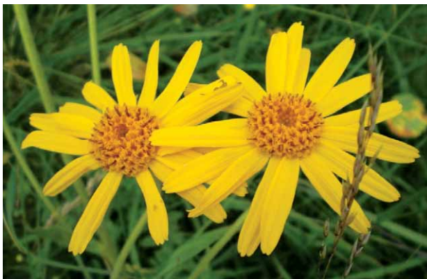
Slika 3. Cvat gorske moravke – Arnica montana L. (15)

Đumbir je višegodišnja zeljasta biljka koja nije poznata kao samonikla pa spada u red vrlo starih kultiviranih biljaka. Kina je glavna izvoznica đumbira. Miris đumbirovog podanka je vrlo aromatičan, a okus je ljut i peče u grlu. Đumbirov podanak sadrži 2,5–3 % eteričnog ulja različitog kemijskog sastava ovisno o podrijetlu (glavne sastavnice su seskviterpenski derivati zingiberen i zingiberol). U podanku se nalaze i organske kiseline, sluzi, šećeri i smolaste tvari (8). Podanak đumbira primjenjuje se u obliku tinktura. Topli oblozi priređeni od podanka koriste se za ublažavanje boli kod artritisa i gihta (13). Eterično ulje đumbira primijenjeno topički na kožu pokazuje analgetski učinak kod dismenoreje (16).