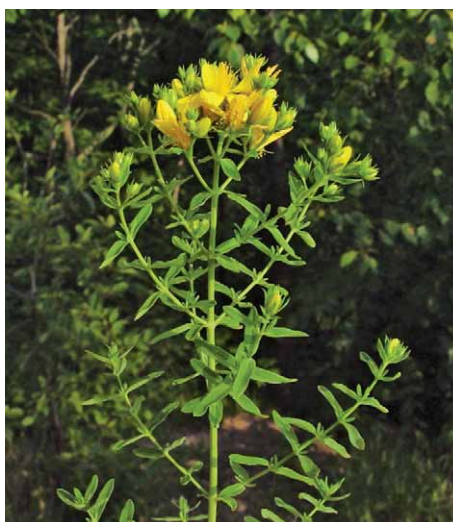
Slika 6. Rupičasta pljuskavica (gospina trava) – Hypericum perforatum L. (20)

Rupičasta pljuskavica (gospina trava ili trava sv. Ivana) – Hypericum perforatum L., Hypericaceae (7) (slika 6.) odavno je poznata po ljekovitosti, zabilježili su je farmakobotaničari i uvrštena je u biljaruše (9). To je višegodišnja zeljasta biljka sa sitnim jajastim listovima s puno prozirnih točkica, pa na svjetlu izgledaju kao probušeni (perforirani), odakle potječe i naziv biljke. Te točkice zapravo su žlijezde ispunjene eteričnim uljem. Djelotvornost i ljekovitost ove biljke je velika i složena, što je rezultat njezinog kompleksnog kemijskog sastava. Ljekovitost se temelji u sadržaju naftodiantronskih spojeva (hipericin, pseudohipericin, protohipericin, protopseudohipericin), flavonoida (rutin,