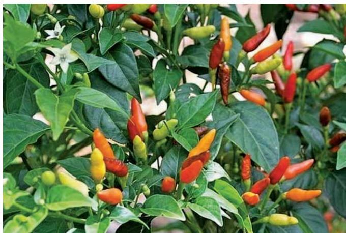
Slika 4. Ljuta paprika – Capsicum frutescens L. (18)

Ljuta paprika ( Capsicum frutescens L., Solanaceae) (8) (slika 4.) je jednogodišnji razgranati grm. Osušeni zreli plodovi paprike sadržavaju protoalkaloid kapsaicin, karotenoide, flavonoide te askorbinsku kiselinu. Protoalkaloidi djeluju na zavšetke