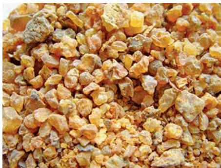
Slika 3. Mira (9)

miri je potvrđeno i analgetsko djelovanje. Vanjska upotreba joj je za ispiranje grla i usta, a koristi se i u obliku alkoholnih otopina za liječenje upale sluznice usta i ždrijela. Tinktura se primjenjuje u stomatologiji uz niz drugih preparata, a najviše pri parodontnim bolestima. Česta je u otopinama za premazivanje zubnog mesa, vodama za usta i zubnim pastama (3, 4).