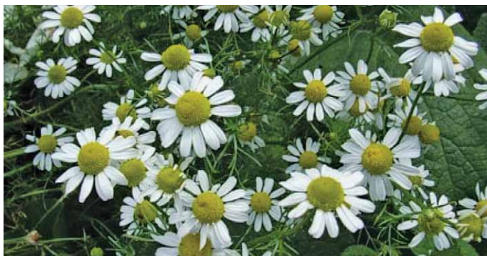
Slika 5. Kamilica – Chamomilla recutita (L.) Rauschert (15)

Kamilica, Chamomilla recutita (L.) Rauschert (= Matricaria chamomilla L.), Asteraceae (6), ima protuupalna i antiseptička svojstva (slika 5.). Osim što je učinkovita u liječenju bolesti desni, kamilica se rabi i u sprječavanju njihove pojave (14). Glavni sastojak kamilice zaslužan za njena ljekovita svojstva je eterično ulje kojeg ima i do 1,9 %, a za protuupalno djelovanje najvažniji su kamazulen, bisabolol i bisabolol oksid. Kamilica se koristi kao sredstvo za grgljanje ili ispiranje usta (3, 4).