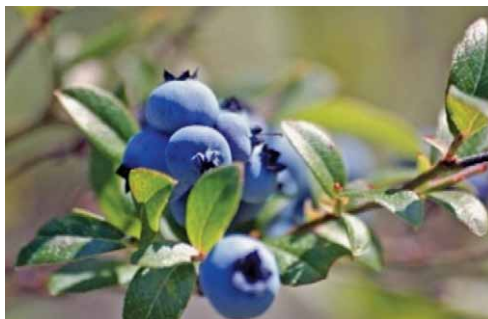
Slika 11. Niskogrmolika borovnica – Vaccinium angustifolium Aiton (26)