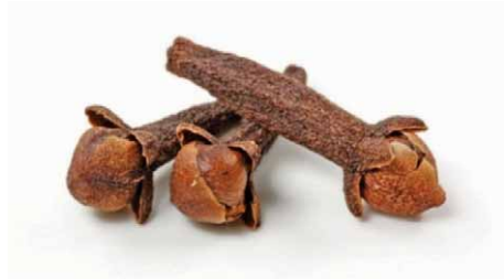
Slika 7. Cvjetni pupoljci klinčića – Syzygium aromaticum (L.) Merrill et L. M. Perry (19)

Cimet je začin koji se dobiva od cimetovca, malog grmolikog drva iz porodice lovorovki. Kora (slika 9.) i listovi su aromatični, a cvjetovi imaju neugodan miris. Podatke o njemu Europljani dobivaju 1498. kad je Vasco da Gama zaposjeo Cejlon (današnju Šri Lanku) kao portugalski posjed. Danas se uzgaja u gotovo svim tropskim područjima svijeta. Ljekoviti se cimet dobiva samo iz vrste Cinnamomum zeylanicum Nees ( Cinnamomum verum L.) koja potječe upravo sa Šri Lanke (cejlonski cimet). Sličan sastav ima kasija (kineski cimet), koja se proizvodi od vrste Cinnamomum cassia Blume ( Cinnamomum burmannii (Nees & T. Nees) Nees ex Blume ili vrste Cinnamomum aromaticum Nees), podrijetlom iz Burme. On se najčešće prodaje u