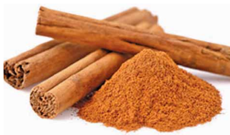
Slika 9. Cejlonski cimet – Cinnamomum zeylanicum Nees (23)

Neka od novijih istraživanja pokazuju da se i ekstrakt niskogrmolikih borovnica, Vaccinium angustifolium Aiton (slika 11.) pokazao uspješnim u sprječavanju nastanka zubnih naslaga i bolesti zubnog mesa. Ključna sastavnica ekstrakta je polifenol, anti-