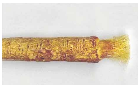
Slika 10. Kora vrste Salvadora persica L. (24)