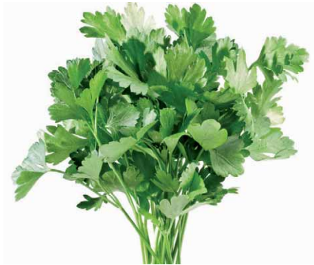
Slika 8. Peršin – Petroselinum sativum Hoffm. (21)