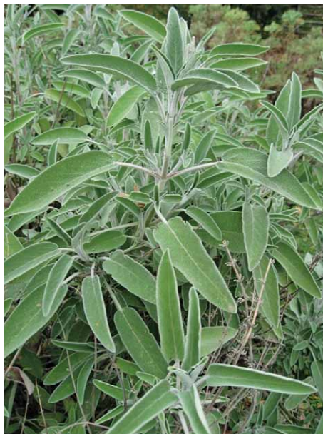
Slika 4. Kadulja – Salvia officinalis L. (13)