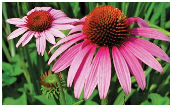
Slika 6. Crvena (grimizna) rudbekija – Echinacea purpurea (L.) Moench (16)

Poznata kao ukrasna biljka, crvena (grimizna) rudbekija, Echinacea purpurea (L.) Moench iz porodice Asteraceae također se preporučuje u liječenju gingivitisa (slika 6.). Ova biljka djeluje antibakterijski i jača imunološki sustav (3). Tinktura rudbekije dodaje se čajevima za liječenje gingivitisa i vodama za ispiranje usta. Može izazvati peckanje i utrnuće jezika, ali ta je pojava posve bezopasna (14).