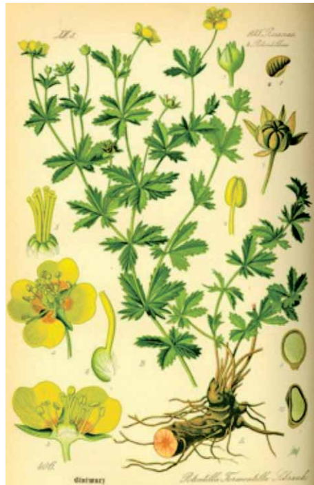
Slika 2. Uspravna petoprsta – Potentilla erecta (L.) Rauschel (7)