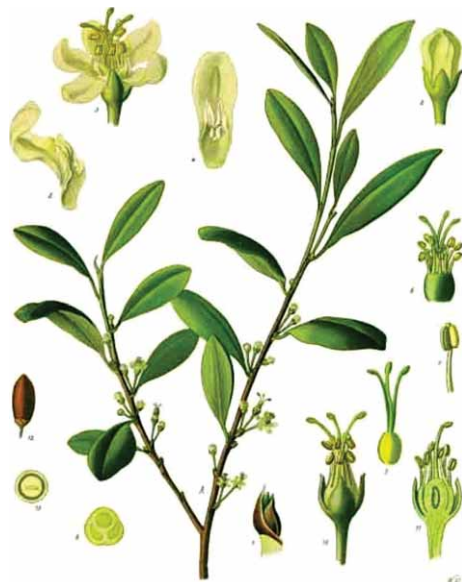
Slika 3. Erythroxylum coca Lam., Erythroxylaceae (8)

Drogu čine osušeni listovi uzgojene koke, a karakterizira ih raznolik sastav alkaloida od kojih je najbitniji kokain, neurostimulirajuća sastavnica, ilegalna u većini zemalja svijeta, pa tako i u Republici Hrvatskoj (10). Kao izvor droge koriste se obje vrste koke, a razlikuju se tri različita varijeteta: E. coca var. coca , poznat kao bolivijanska ili huanako-koka, te dva varijeteta vrste E. novogranatense : E. novogranatense var. novogranatense , kolumbijska koka i E. novogranatense var. truxillense , tzv. peruanska ili truxillo-koka. Udio raznih alkaloida, pa tako i kokaina je različit ovisno o pojedinom varijetetu, a temelj njihova međusobnog raspoznavanja su oblik i boja listova.