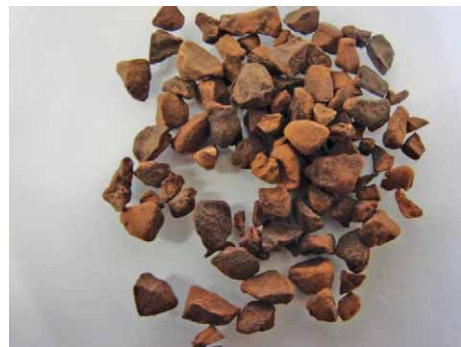
Slika 6. Colae semen (23)