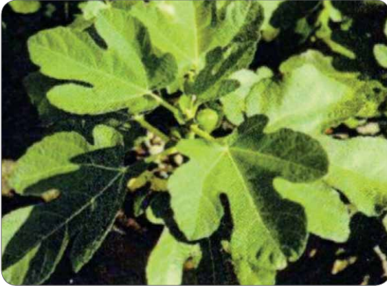
Slika 3. Listovi smokve – Ficus carica L.

Kao stablo koje je raslo u Rajskom vrtu spominje se smokva – Ficus carica L. Ona je još i u vrijeme Grka i Rimljana bila cijenjena kao simbol muškosti, plodnosti i moći. Smokva je prva biljka koja se navodi u Bibliji. Raste u obliku niskog listopadnog drveta ili grma koje ima široko razgranatu krošnju. Listovi su joj veliki i dlanasto krpasti (slika 3.). Njeni slatki plodovi vrlo su ukusni za jelo (slika 4.). To je tipična biljka sredozemnog podneblja, ali se u uzgoju javlja i u pojedinim kopnenim dijelovima Hrvatske (1, 6).