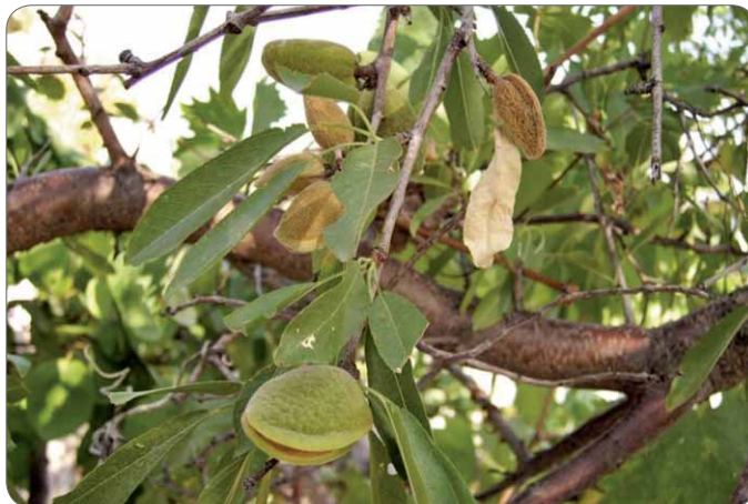
Slika 5. Grane badema – Prunus amygdalus Stokes s listovima i plodovima

Stablo i plodovi badema – Prunus amygdalus Stokes često su spominjani u Bibliji (1). Badem naraste kao dosta visoko drvo. Ima produžene i zašiljene listove pilastog ruba i ružičaste ili bijele cvjetove, koji se javljaju vrlo rano, obično prije listova (2). I