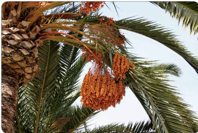
Slika 2. Grana datulje – Phoenix dactylifera L. s listovima i plodovima

Datulja – Phoenix dactylifera L. pripada porodici palmi – Arecaceae (Palmae). Bila je važna ne samo za prehranu, nego i kao simbol pravde, svetosti i uskrснуća u kršćanstvu. Ova biljna vrsta rasprostranjena je u svim tropskim zemljama, a stabljika joj naraste i do 20 m. Njezini su listovi veliki i perasto rascijepani, dok se neugledni cvjetovi razvijaju u gustim cvatovima. Plodovi su vrlo slatke i hranjive koštunice, datulje (slika 2.) (5). Držeći palmine grane u rukama ljudi su pozdravljali Isusa kada je ulazio u Jeruzalem jašući na magarcu. Danas nošenjem palminih grana priznajemo Kristovo vodstvo kroz život i smrt.