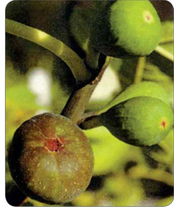
Slika 4. Nezreli i zreli plodovi smokve – Ficus carica L.

Stablo i plodovi badema – Prunus amygdalus Stokes često su spominjani u Bibliji (1). Badem naraste kao dosta visoko drvo. Ima produžene i zašiljene listove pilastog ruba i ružičaste ili bijele cvjetove, koji se javljaju vrlo rano, obično prije listova (2). I