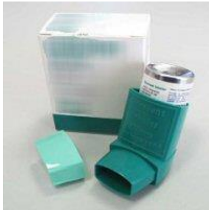
Slika 2. Klasični MDI-pumpica