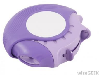
Slika 6: Discus