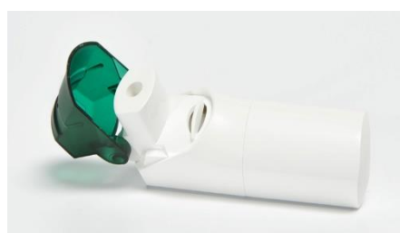
Slika 12. Spiromax