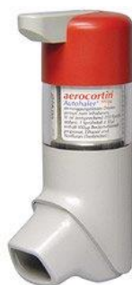
Slika 4. BAI (breath actuated inhaler)-autohaler

Autohaler-BAI (breath actuated inhaler) je tehnološki napredniji MDI zato jer eliminira potrebu koordinacije inhalacije i aktivacije lijeka. Takav inhaler se propisuje bolesnicima koji ne mogu ispravno koristiti klasičan MDI. On se aktivira udahom i ne ovisi o inhalatornoj snazi pacijenta (Vukić-Dugac, 2013).