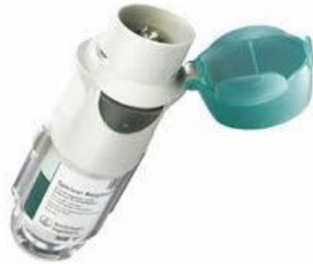
Slika 11. Respimat