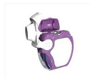
Slika 13. Forspiro