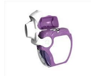
Slika 13. Forspiro