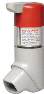
Slika 4. BAI (breath actuated inhaler)-autohaler ( www.almostadoctor.com )

Autohaler-BAI (breath actuated inhaler) je tehnološki napredniji MDI zato jer eliminira potrebu koordinacije inhalacije i aktivacije lijeka. Takav inhaler se propisuje bolesnicima koji ne mogu ispravno koristiti klasičan MDI. On se aktivira udahom i ne ovisi o inhalatornoj snazi pacijenta (Vukić-Dugac, 2013).