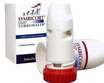
Slika 7: Turbuhaler