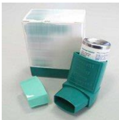
Slika 2. Klasični MDI-pumpica ( www.astma.hr )