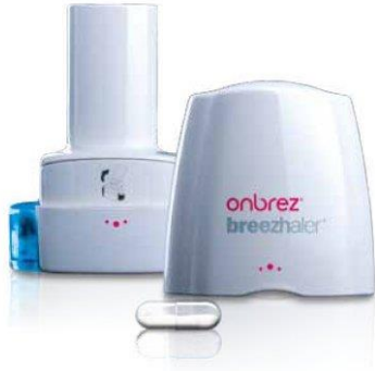
Slika 8. Breezhaler