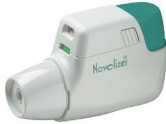
Slika 9. Novolizer