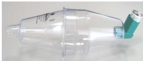
Slika 3. Klasični MDI s komorom za inhaliranje ( www.astma.hr )

Autohaler-BAI (breath actuated inhaler) je tehnološki napredniji MDI zato jer eliminira potrebu koordinacije inhalacije i aktivacije lijeka. Takav inhaler se propisuje bolesnicima koji ne mogu ispravno koristiti klasičan MDI. On se aktivira udahom i ne ovisi o inhalatornoj snazi pacijenta (Vukić-Dugac, 2013).