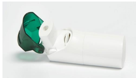
Slika 12. Spiromax