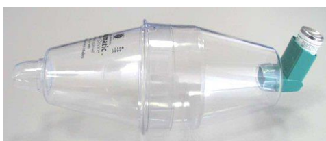
Slika 3. Klasični MDI s komorom za inhaliranje

Autohaler-BAI (breath actuated inhaler) je tehnološki napredniji MDI zato jer eliminira potrebu koordinacije inhalacije i aktivacije lijeka. Takav inhaler se propisuje bolesnicima koji ne mogu ispravno koristiti klasičan MDI. On se aktivira udahom i ne ovisi o inhalatornoj snazi pacijenta (Vukić-Dugac, 2013).