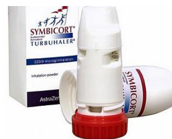
Slika 7: Turbuhaler