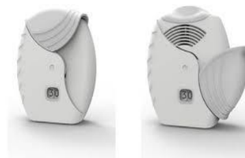
Slika 10: Ellipta