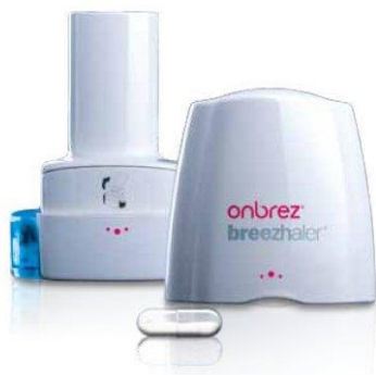
Slika 8. Breezhaler