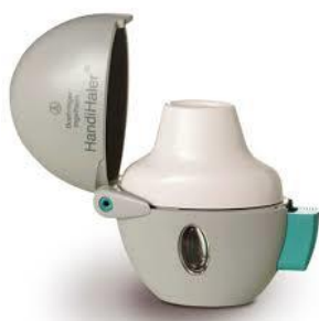
Slika 5: HandiHaler

Tipovi inhalera na hrvatskom tržištu koji su raspršivači praškastog lijeka su: HandiHaler, Discus, Turbuhaler, Novolizer, Breezhaler, Ellipta, Respimat, Spiromax i Forspiro ( www.hljk.hr ). Izgled svakoga od njih prikazuju slike numerirane brojevima 5-13. Oni se međusobno razlikuju u načinu korištenja pa tako uz svaki od njih vežemo neke zasebne pogreške koje se mogu pojaviti kod upotrebe.