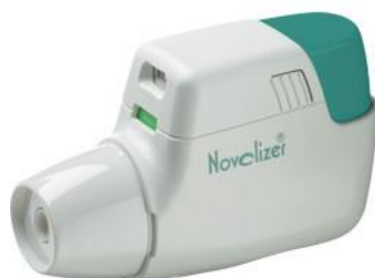
Slika 9. Novolizer