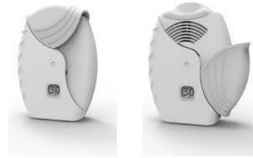
Slika 10: Ellipta