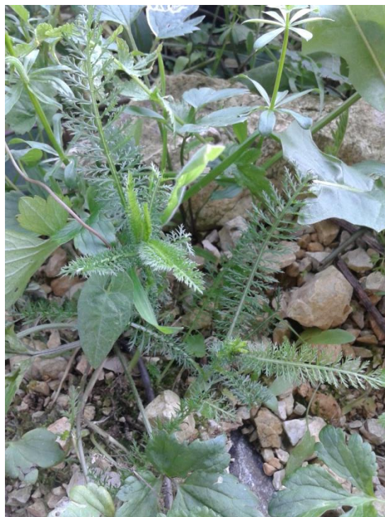
Slika 4.1. Achillea millefolium L.

Achillea millefolium L. (obični stolisnik, hajdučka trava, kunica) je višegodišnja biljna vrsta rasprostranjena u Europi, sjevernoj Aziji i Americi. Raste po livadama, pašnjacima i poljima u području umjerene klime. Ima puzavi podanak iz kojeg izbija prizemna rozeta listova, a zatim cvjetna stabljika. Listovi su dvostruko i trostruko perasti s više od 10 glavnih isperaka, dužine do 20 cm. Stabljika je okrugla, zelenkaste boje, a pri vrhu se grana. Može biti dlakava i visine do 70 cm. Brojne cvatne glavice sastavljene su od najčešće 5 žućkastobijelih, bijelih, ružičastih ili grimiznih jezičastih cvjetova i nekoliko žućkastih cjevastih cvjetova. Stolisnik cvate od lipnja do rujna. Plod je roška duga oko 2 mm (Schaffner i sur., 1999; Kuštrak, 2005; Pahlow, 1989).