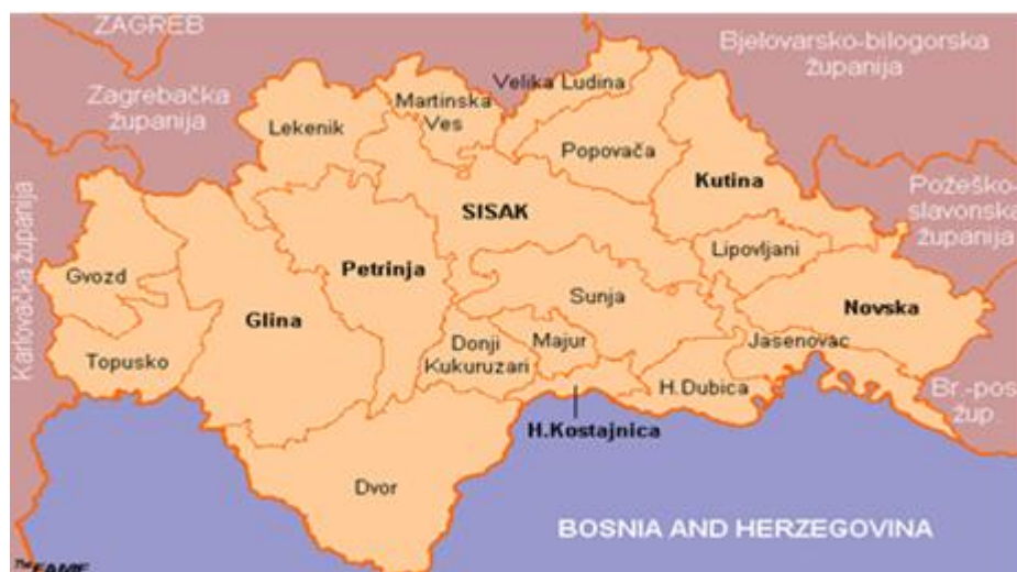
Slika 3.1. Karta Sisačko-moslavačke županije

Terensko istraživanje provedeno je u razdoblju od svibnja do srpnja 2016. godine na području pet sela u okolini grada Novske: Nova Subocka, Stara Subocka, Sigetac, Brestača i Lipovljani. Područje istraživanja smješteno je u zapadnoj Slavoniji, u Sisačko-moslavačkoj županiji. Prirodna je veza obronaka slavonskog gorja i posavske ravnice, s nadmorskom visinom koja se proteže od 90 do 467 m. Na području Novske vlada umjerena kontinentalna klima.