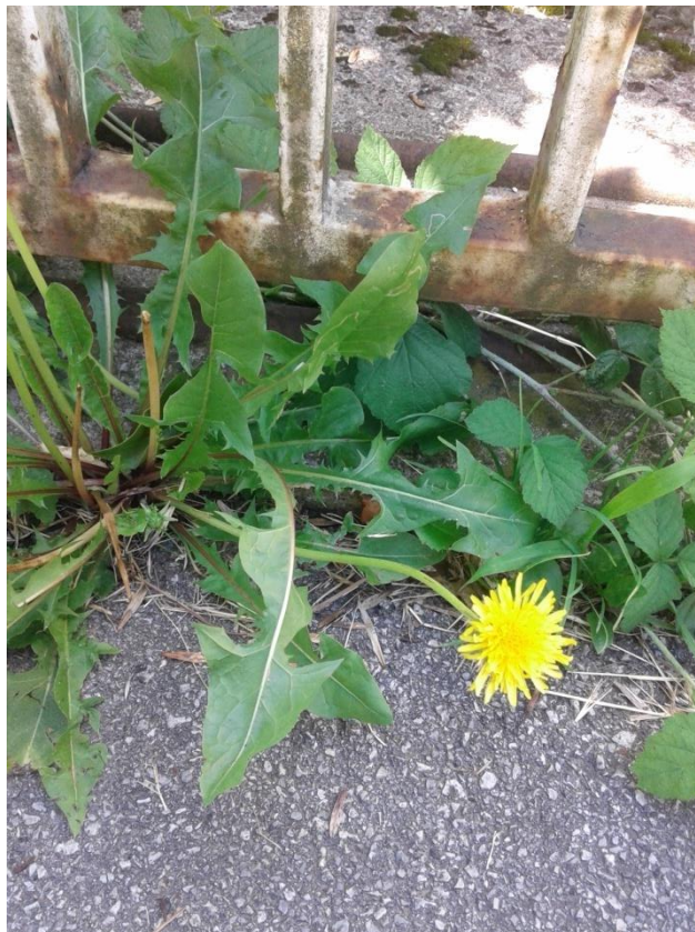
Slika 4.19. Taraxacum officinale Webber

Taraxacum officinale Webber (obični maslačak) je zeljasta trajna biljka autohtona u Europi i dijelu Azije. Danas je rasprostranjen u cijelome svijetu. Raste na područjima od nizinskih do visokoplaninskih, na livadama, travnjacima te u vrtovima. Korijen maslačka je razgranat i valjkast, a dugačak je oko 20 cm. Stabljika je šuplja, visoka do 30 cm i nosi jednu cvjetnu glavicu. Sadrži mliječni sok. Listovi su različitog oblika, najčešće duboko perasto urezani i formiraju prizemnu rozetu. Dugi su 5-25 cm. Rub listova je pilasto nazubljen. Zreli plodovi imaju na vrhu dugi kljun koji na svom vrhu nosi čuperak raširenih dlačica, papus, pomoću kojih se rasprostire vjetrom. Cvate u travnju i svibnju, ponekad ponovno u rujnu i listopadu (Kuštrak, 2005; Pahlow, 1989; Schaffner, 1999).