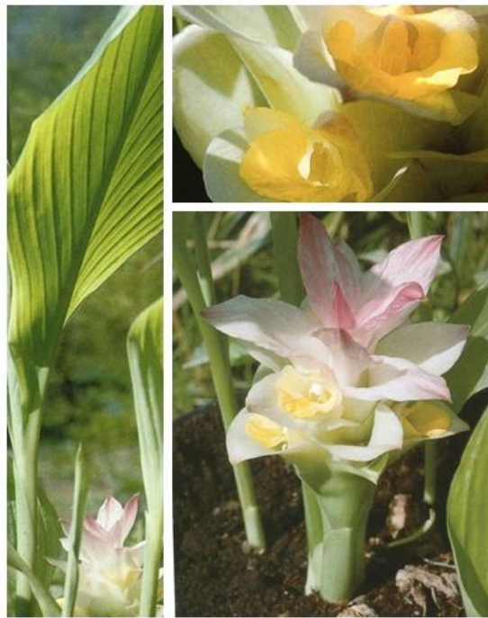
Slika 1. Curcuma longa L. (Schafner i sur., 1999)

Rod Curcuma L. (Zingiberaceae) sadrži više od 100 biljnih vrsta, među kojima je najpoznatija Curcuma longa L. To je višegodišnja biljka koja može narasti do 1,5 m visine iz gomoljastog podanka. Ima sjajne, velike, duguljaste ili široko lancetaste listove s dugom peteljkom i guste klasove blijedožutih cvjetova koji su ovijeni zaštitnim listom (slika 1). Glavni podanak je okruglast, 5 cm dug i 3 cm širok, s vodoravnim ožiljcima od listova. Ispod glavnog podanka razvija se korijenje koje mjestimično zadeblja i poprima cilindričan oblik (sekundarni podanci). Podanak je izvana žućkast, a u unutrašnjosti narančast do crvenkastosmeđ (slika 2) (online.lexi.com; Schafner i sur., 1999).