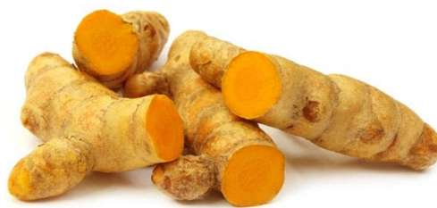
Slika 2. Kurkumin podanak

( https://authoritynutrition.com/top-10-evidence-based-health-benefits-of-turmeric )