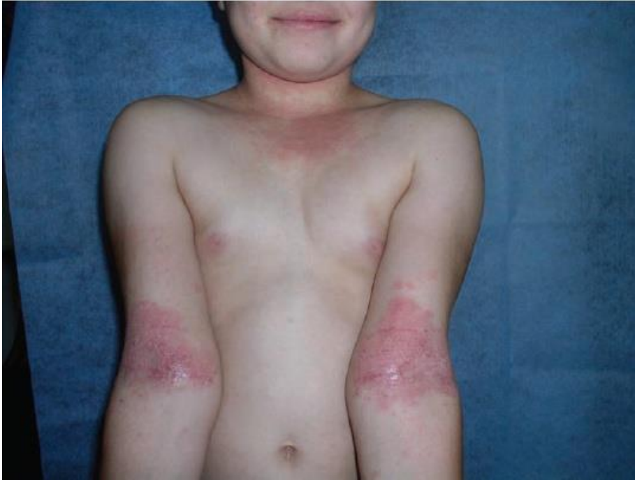
Slika 2. Karakteristična distribucija kod starijeg djeteta (vrat, dekolte, pregibi laktova ) (Murat-Sušić, 2007).