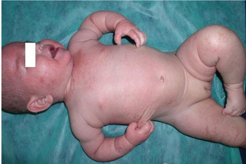
Slika 1. Dojenče s generaliziranim atopijskim dermatitisom uz izražen svrbež (Murat-Sušić, 2007).