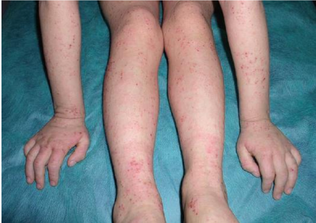
Slika 3. Generalizirane promjene uz ekzorijacije na ekstremitetima (Murat-Sušić, 2007)