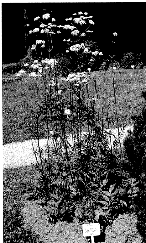
Slika 1. Valeriana officinalis L. (Odoljen), Farmaceutski botanički vrt »Fran Kušan« Zavoda za farmaceutsku botaniku, Farmaceutsko-biokemijskog fakulteta Sveučilišta u Zagrebu

Valepotriati nisu stabilni nakon usitnjavanja korijena, dužeg skladištenja, naročito ne u pripravcima odoljena (3). Seskviterpenske kiseline kao što su valerenska kiselina, ace-