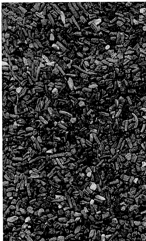
Slika 2. Valerianae radix , komercijalna biljna droga u prometu