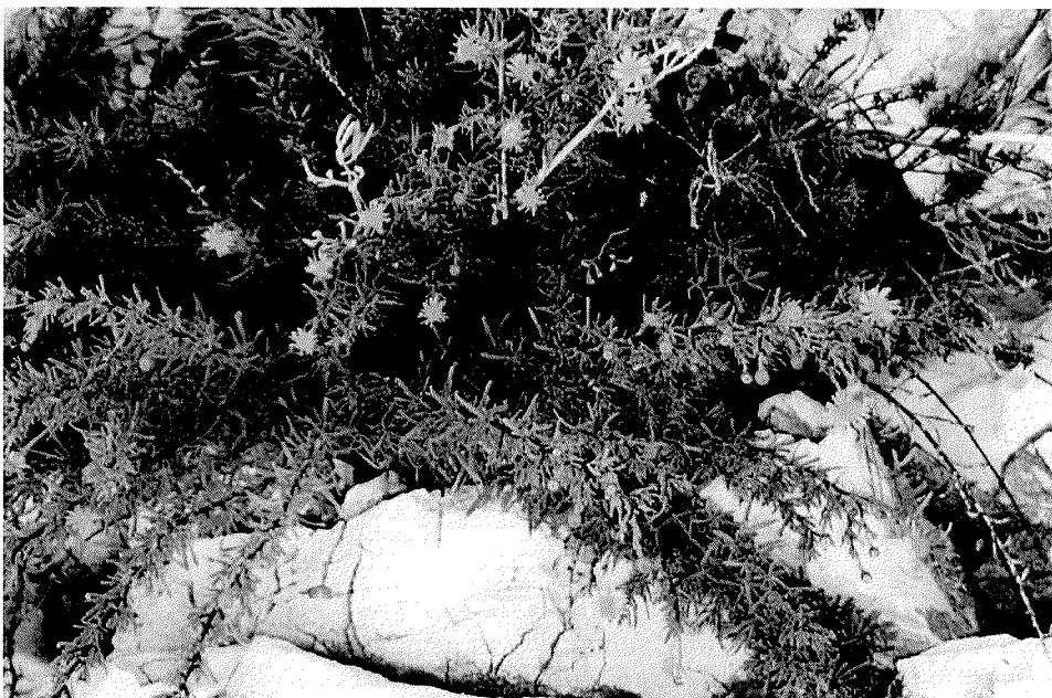
Slika 1. Limbarda crithmoides (L.) Dumort. – primorski oman

Primorski oman je polugrm s drvenastim prizemnim dijelom iz kojeg izbijaju uspravne mesnate stabljike, sa smolnim kanalima, koje narastu i do jednog metra. Listovi su izmjenični, mesnati, goli, do 6 cm dugi i manje od 1 cm široki, linearni do linearno-suličasti, cjeloviti ili pri vrhu trostruko rascjepani. Cvjetovi koji se nalaze u gornjem dijelu stabljike, na vrhovima ograna, skupljeni su u glavice promjera oko 25 mm. Jezičasti cvjetovi su do 25 mm dugi, obično dva puta duži od unutrašnjih brakteja i zlatno-žute su boje, dok su pravilni, središnji, cjevasti cvjetovi narančasto-žuti ( Slika 1. )