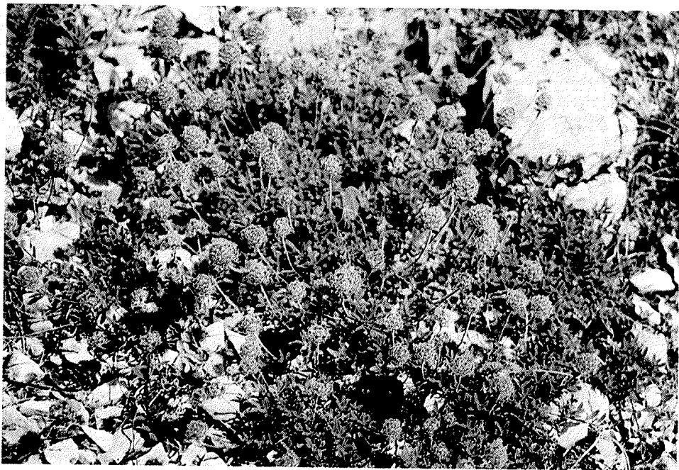
Slika 1. Thymus bracteosus Vis. ex Benth. – Mekolisna majčina dušica

ma koje na tlu izgledaju poput saga. Cvjetni ogranci su tanki, okrugli, pokri- veni dlakama, a uzdižu se do visine od desetak centimetara. Listovi su nasuprotni, duguljasti, tupog vrha, a prema bazi se klinasto suzuju u petelj- ku. Gusto su pokriveni glavičastim dlakama jednostaničnog drška i štitastim žlijezdanim dlakama, dok po rubu njihove donje polovice dolaze jednostavne, višestanične, stršeće dlake. Cvatovi su glavičasti, oko 15 mm u promjeru, a sastoje se od 7–15 i više cvjetova koji su na kratkom dršku (Slika 1.). Čaška je 5–7 mm duga, sastavljena od sraslih lapova unutar kojih se nalazi snopić gustih bijelih dlaka. Vjenčić je ružičast, sulatičan, oko 2 mm duži od čaške, gornja mu je usna ravna i izrubljena dok je donja svinuta i trokrpasta. Plod je cijepavac koji se u zreloom stanju raspada na četiri jednosjemena, polukug- lasta oraščića. Pricvjetni listovi ili brakteje po kojima je vrsta i dobila la- tinski dijagnostički pridjevak bracteosus izrazito su širi od pravih listova te se zbog njihova izgleda mekolisna majčina dušica lako razlikuje od ostalih vrsta u području svog areala.