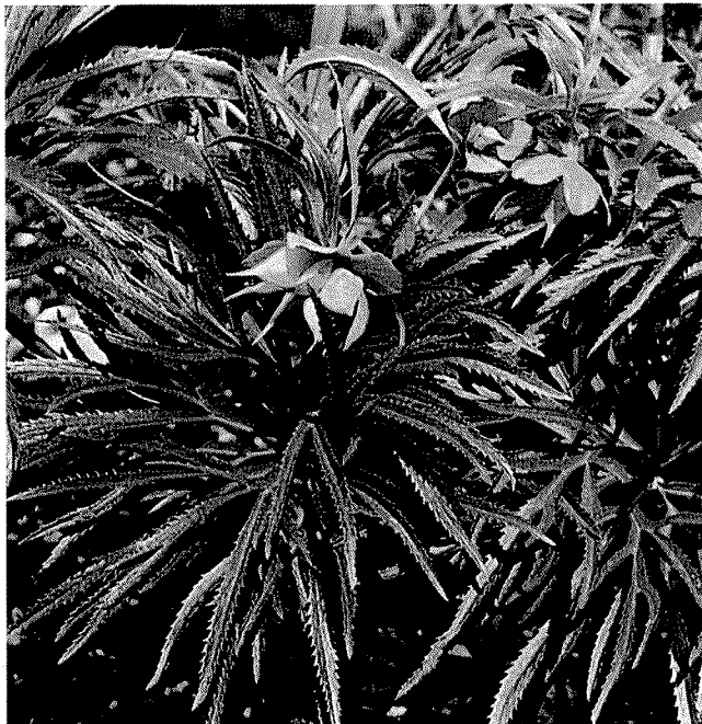
Slika 1. Helleborus multifidus Vis. subsp. multifidus – Krški kukurijek

istriacus (Schiffner) Merxm. et Podl., H. multifidus Vis. subsp. multifidus i H. multifidus serbicus (Adamović) Merxm. et Podl. (5,6). Tipičnu podvrstu ( H. multifidus Vis subsp. multifidus ) lako je razlikovati od ostalih dviju po obliku listova i po cvjetovima zelene boje. Ova podvrsta rasprostranjena je u Dinaridima od Slovenije sve do Albanije, dok je dvojbeno njeno pojavljivanje izvan tog areala. Raste na vapnenačkoj i dolomitnoj podlozi od primorskih pa sve do viših gorskih položaja u kontinentalnim krajevima. Staništa ove biljne svojte najčešća su u području termofilnih šuma hrasta medunca s bijelim ili crnim grabom, u makiji, po kamenjarima te u manjoj mjeri i na mjestima prevladavanja bukovih šuma (2,4,5,7).