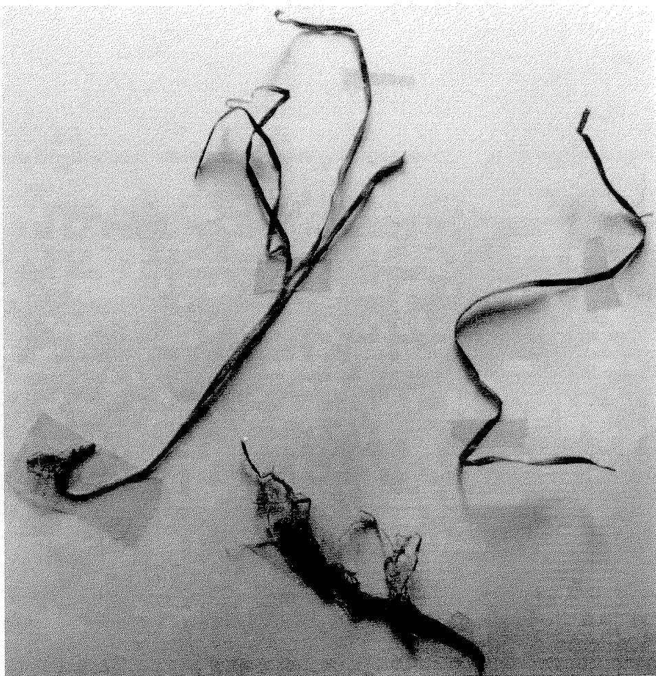
Slika 1. Zostera noltii Hornem. – Patuljasta svilina

guste podvodne livade. U nas su takve podmorske livade posebno dobro razvijene uz obale Istre i Kvarnerskog otočja (3,6,7).