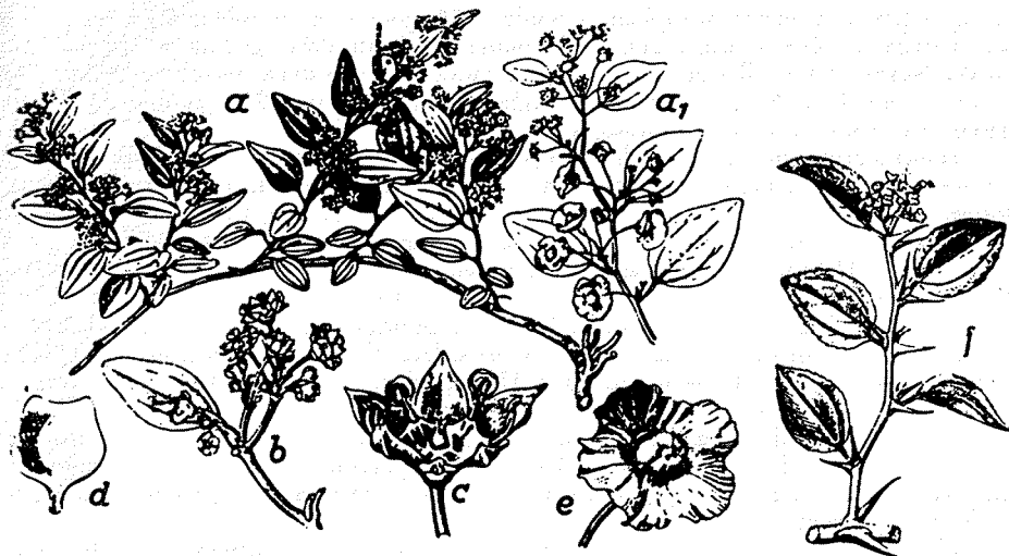
Slika 1. Drača-Paliurus spina-christi Mill.

(iz G. Hegi: Illustrierte Flora von Mittel-Europa, Band V/1. Teil, Carl Hanser Verlag München, 1954, s. 327.)