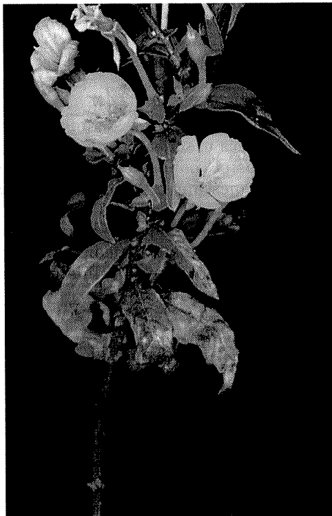
Slika 1: Pupoljka ( Oenothera biennis L.)

Pupoljka ( Oenothera biennis L.) je dvogodišnja biljka, visoka do 130 cm. Prve godine u jesen razvije se gusta, po tlu raširena rozeta, s produženo jajolikim, kratko zašiljenim listovima, koji se sužavaju u dugu peteljku. Tek dru-