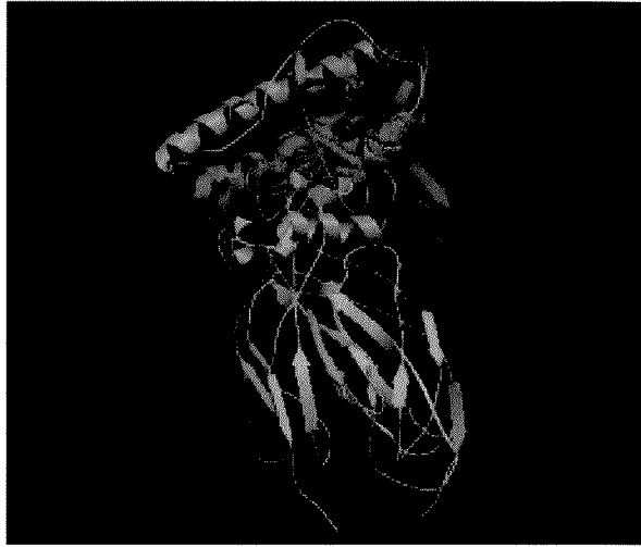
Slika 1. Struktura eritropoetina s ekstracelularnim domenama EPO-receptora (4).

nih proteina koji su neophodni za sazrijevanje eritrocita (4, 6). Povećani broj funkcionalnih crvenih krvnih stanica ima za posljedicu bolju opskrbu tkiva kisikom. Eritropoetin djeluje na stanice preko specifičnog receptora (EPO-R, EpoR). Smatra se da postoje barem dva vezna mjesta različitog afiniteta za eritropoetin, a potvrđeno je postojanje endogenog čimbenika koji povećava afinitet receptora za eritropoetin. Poznato je da i tumorske stanice imaju EPO receptore te se pretpostavlja da eritropoetin može poticati rast nekih tumora (2).