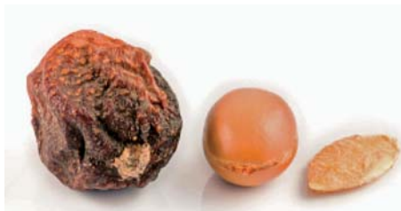
Slika 3. Osušeni plod, orah i sjemenka argana

Zreli plodovi sadrže smeđu ovojnicu (slika 3.) koja se mora ukloniti da bi došli do pulpe i oraha unutar kojeg se nalaze sjemenke s uljem.