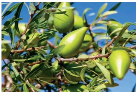
Slika 1. Grančice argana s listovima i plodovima