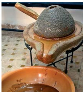
Slika 4. Kamena miješalica