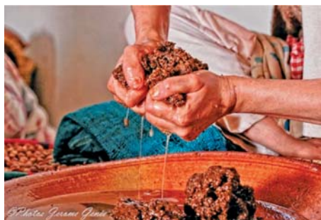
Slika 5. Tiještenje arganovog ulja

čestice istaložile, a dalje se može filtrirati ovisno o željenom zahtjevu čistoće (5). Tekstura mu je gusta i pri nanošenju na kožu teška, ali ima brzu moć upijanja, za razliku od krivotvorenih ulja koja su obično lagane teksture i »skliska« na koži.